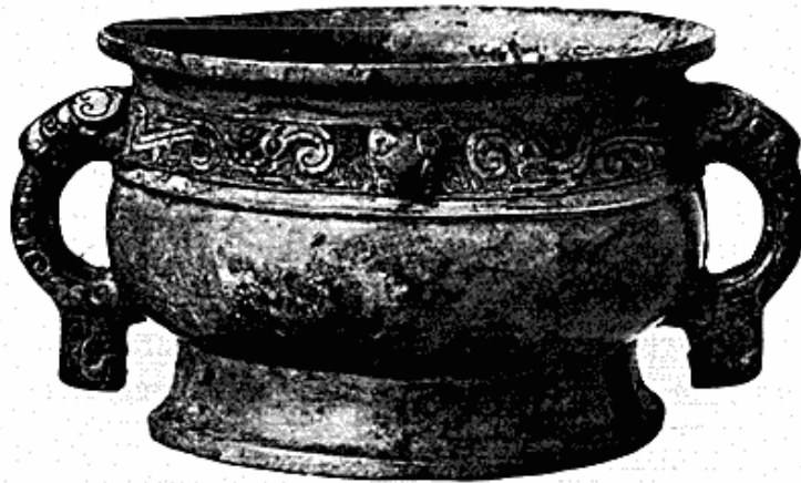
Fig. 2. Bronzekumme ( kuei ) fra tidlig Chou-tid. Kina.

Fra Kina er årets værdifuldeste forøgelse uden tvivl en bronze-