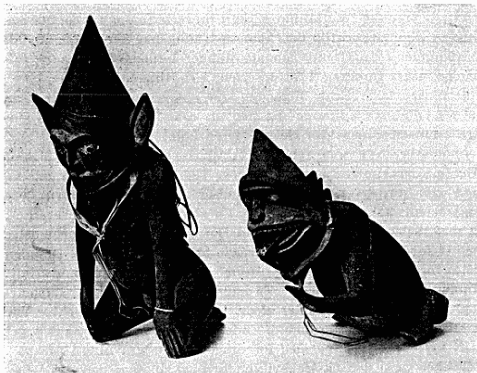
Fig. 1. Træfigurer forestillende onde ånder. Nicobarerne.

nået til København i årets løb; men i følge de indløbne oplysninger har han opmålt og gennemfotograferet fire hidtil upåagtede, hinduistiske huletempler fra det 6. århundrede ved Badami i Mysore, afsluttet sine studier blandt todaerne og yderligere undersøgt forskellige primitive junglestammer i Travancore. Fra Travancore stammer også en kano og en plov, skænket af ingeniør S. Rüdin-