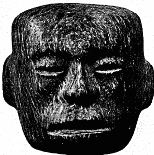
Fig. 4. Mexicansk stenmaske.

fra México. Masken er et meget smukt stykke af en type, som kendes både fra aztekerne og Teotihuacán-kulturen (fig. 4), hvorimod figurerne er karakteristiske for de vestligere folkeslag i Michoacán og Oaxaca. Fra Syd-Amerika stammer et pusterør med tilhørende pilekogger fra jivaro-indianerne, skænket af hr. Aage G. Holtved, Quito, og 20 patagonske stenredskaber, som er skænket af hr. Mario Hedegaard i Buenos Aires.