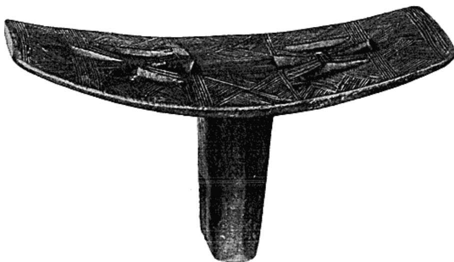
Fig. 6. Ornamenteret skammel fra Bakuba, Congo.

fra Antiksamlingen overført en stor mængde potteskår fundet ved al-Fustât i Ægypten. Denne by, der i midten af det 7. århundrede blev grundlagt af araberne som en befæstet lejr (al-Fustât = latin: fossatum ) tæt ved det nuværende Cairo, blev i 1252 fuldstændig lagt øde af mamlúkkerne. På den gamle bytomt er der fundet umådelige mængder af middelalderlig keramik, som har spillet en vis rolle for dateringen, selv om fundet i denne henseende ikke kan måle sig med de tilsvarende fra Sámarrâ i Iraq. Som sammen-