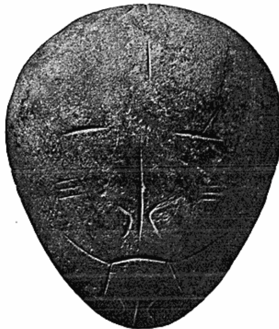
Fig. 5. Palæo-eskimoisk stenlampe med indridset menneskeansigt, Platinum.