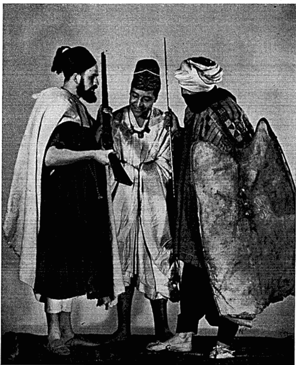
Fig. 1. Fra museets opvisning af islamiske dragter: berber, mandingo og tuareg.

tallet ifjor. I virkeligheden har det dog været ikke så lidt større end således angivet, eftersom skolebesøg ikke er medregnet. Heldigvis er det nu almindeligt, at skolen udnytter de rige muligheder, som museet åbner for at illustrere og udvide undervisningen både i geografi og historie, hvilket må påskønnes så meget mere, som besøg i den Etnografiske Samling mærkeligt nok ikke er obligatoriske, således som de er det for de danske samlingers vedkommende. Forhåbentlig vil man i stigende grad tage museet i undervisningens tjeneste.