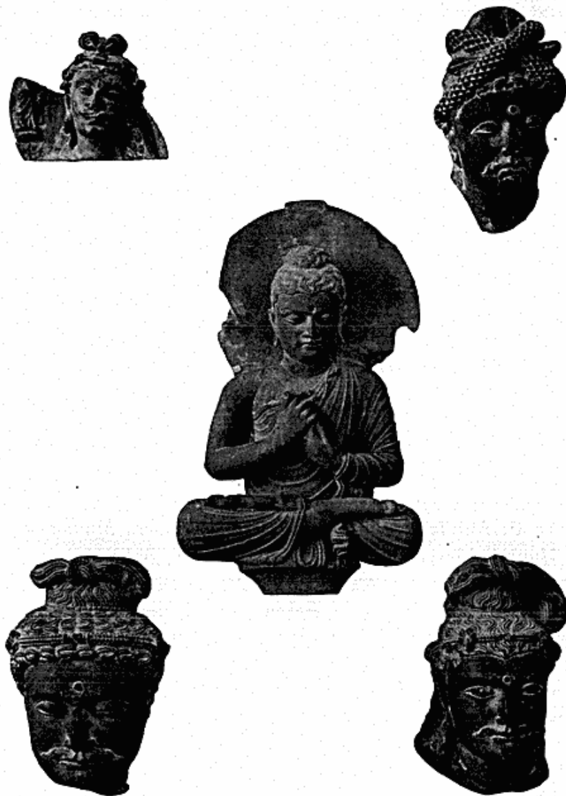
Fig. 2. Indisk stensulptur fra Gandhåra-perioden (begyndelsen af 1. årtusind e. Chr.).