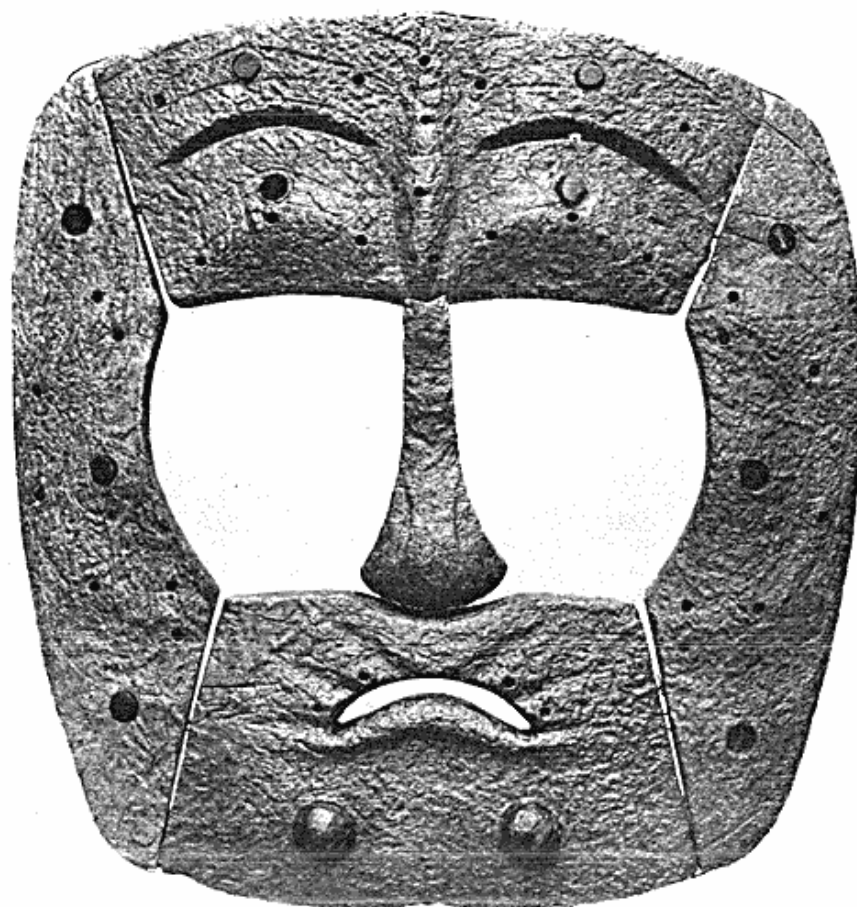
Fig. 3. Benmaske fundet i en grav fra Ipiutak-kulturen, Alaska.

må ligge forud for denne og altså er den ældste form for eskimokultur, der hidtil er fremdraget. Det er indlysende, at dette er et resultat af største betydning for fremtidens forskning.