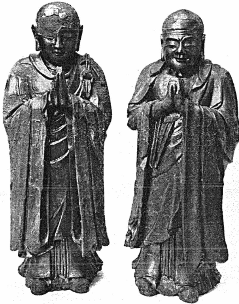
Fig. 1. Træfigurer forestillende Ngo-na og Chia-shih. Ming-perioden, Kina.

i det forløbne år, hvor fondet har bidraget meget væsentligt til indkøbet af to store, forgyldte træfigurer forestillende buddhistiske helgener (Ngo-na og Chia-shih, fig. 1). De stammer begge fra templet i Chi Lo Ssü i Peiping og er uden tvivl fremstillet i Ming-tiden. Fra samme periode hidrører formentlig også et par malerier af taoistiske guddomme, som selskabet Etnografisk Samlings Venner har skænket tillige med to rødlakerede og forgyldte tempelborde fra kejserstaden Jehol. Det er endnu kun få år, det nævnte selskab har kunnet virke; men allerede nu har dets indsats sat sig værdifulde spor i museet. Yderligere har to med-