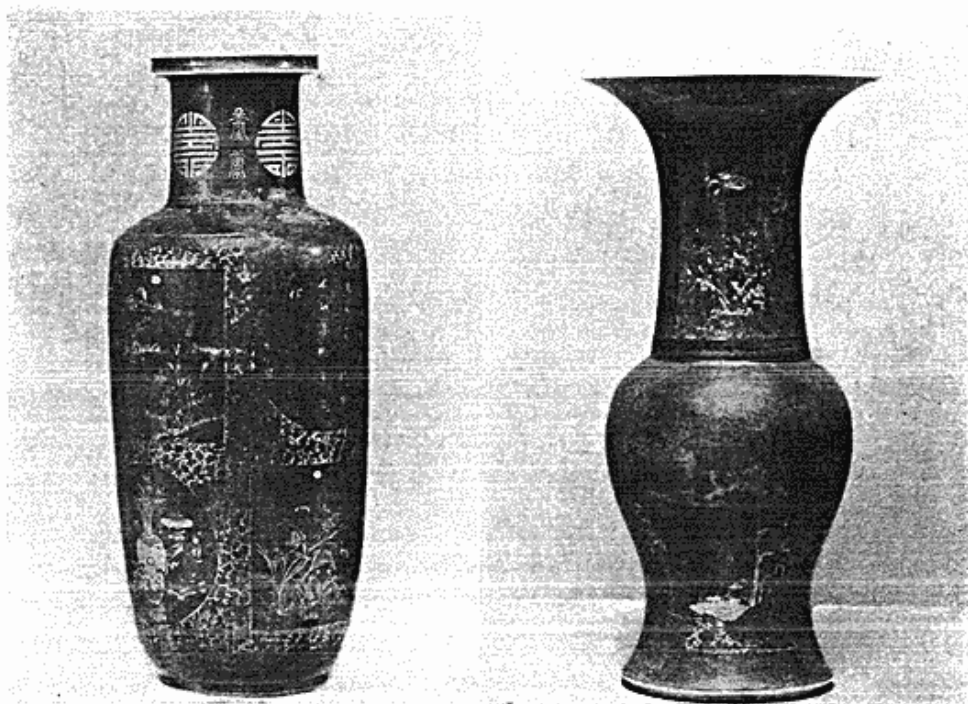
Fig. 2. Kinesiske vaser med gulddekoration på pudderblå bund. K'ang-hsi.

Ved opstillingen af den kinesiske samling viste det sig tydeligere end nogensinde, at endskønt den er ret omfattende og