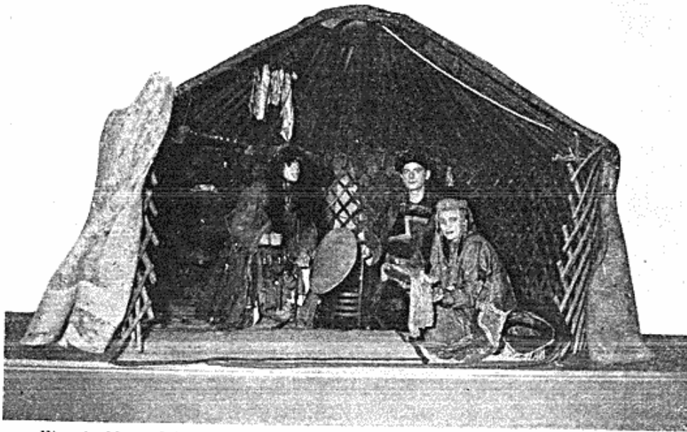
Fig. 1. Møngolsk åndemaning: optrin fra en af Etnografisk Samlings aftenopvisninger.

Af særlig art var nogle foredrag, som i maj måned blev afholdt for en ganske snæver kreds. Museet havde nemlig den glæde at modtage besøg i 3—4 dage af intendenten ved Göte-