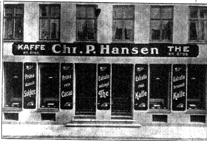
Forretningsfacade mod Peder Hvidfeldtsstræde.

som Forretningsbestyrer for Firmaet, den afdøde havde nemlig bestemt, at Overskuddet af Forretningen fremtidig skulde tilgaa et Legat bærende Navnet »Chr. P. Hansen og Hustrus Kirkefondsløst».