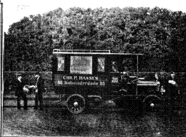
Virksomhedens tre Vareautomobiler.