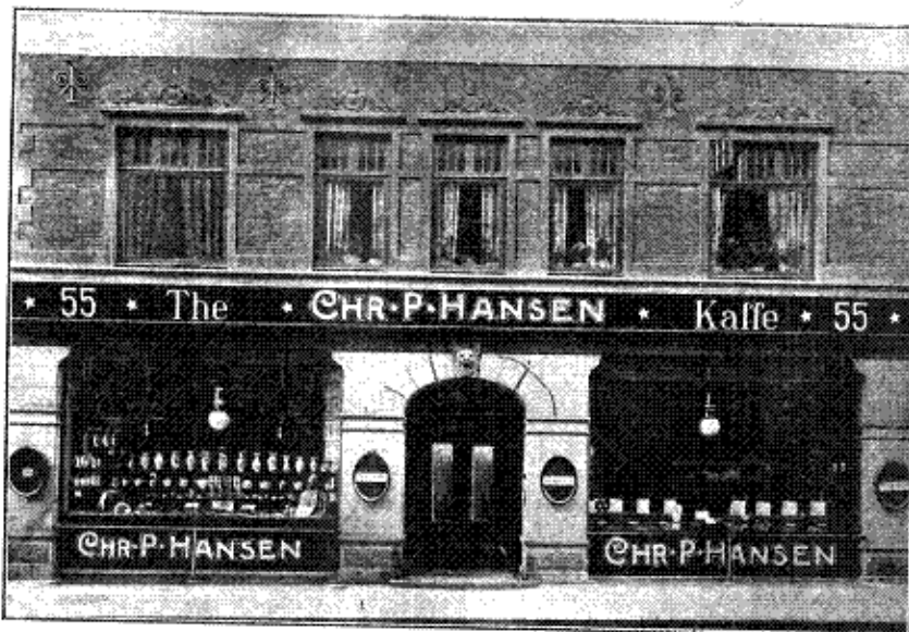
Forretningsfacade mod Købmagergade.