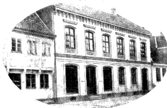
Fra Virksomhedens senere Tid.