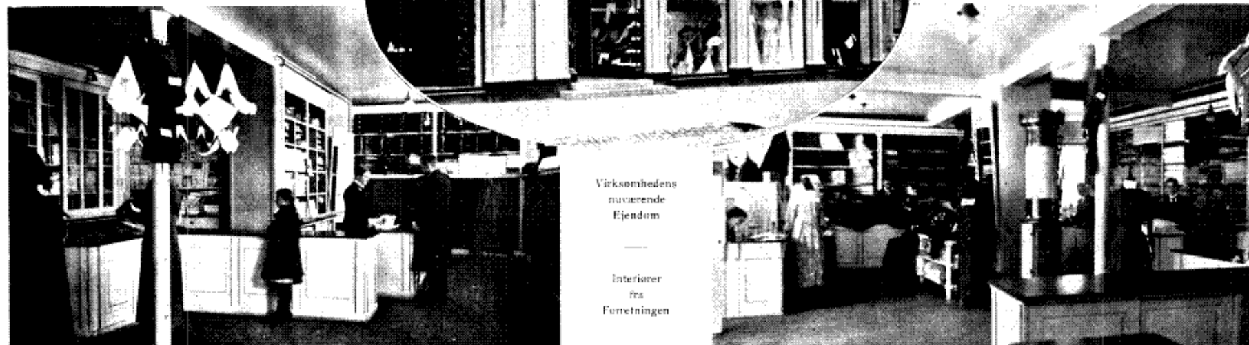
Virksomhedens nuværende Ejendom