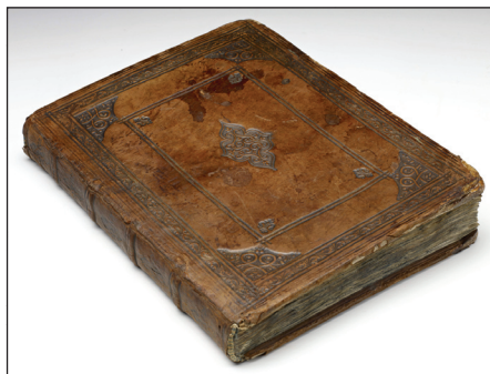
Södermannalagen, indbundet i brunt presset skindbind fra slutningen af 1500-tallet.

I løbet af foråret 2010 var der jævnlig kontakt omkring spørgsmålet om, hvad Danmark kunne give igen for C 37. Den 20. maj kom rigsbibliotekar