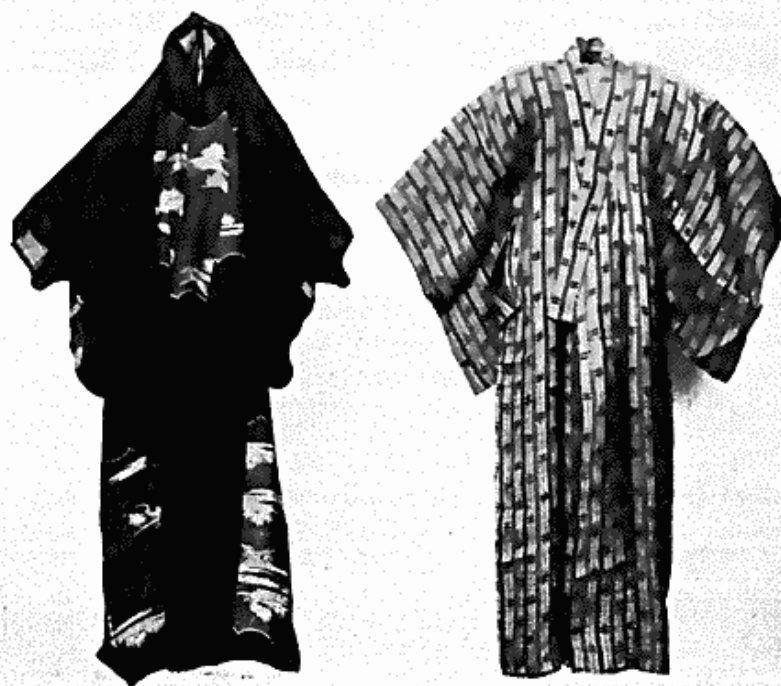
Fig. 1. Begravelsesdragt fra Japan og kimono fra Ryukyu Øerne.