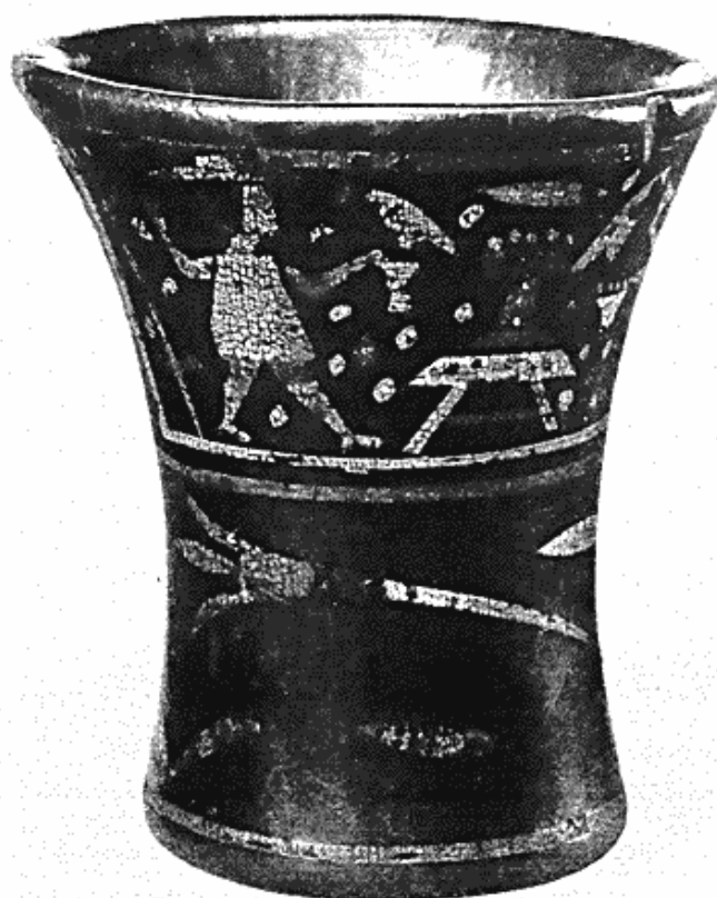
Fig. 4. Lakeret træbæger fra inca-perioden, Perú.

var en følge af præsident Roosevelts New Deal , i stor udstrækning kom arkæologien til gode. En lang række udgravninger blev sat i gang, og derved blev engang for alle hovedlinierne i den før-columbiske kulturudvikling klarlagt. Samtidigt har de moderne undersøgelser med radioaktivt kulstof ( C_{14} ) givet faste holdepunkter for tidsbestemmelserne. Til de ældste spor af menneskelig virksomhed i Nord-Amerika hører de såkaldte Folsom-spidses, der går helt tilbage til afsmeltningsperioden efter istiden. Senere følger en såkaldt arkaisk periode fra ca. 6000 til 1500 f. Chr. med mesolitisk karakter og et erhverv udelukkende baseret på jagt. Efter en overgangstid sætter ca. 1000 f. Chr. en neolitisk agerbrugskultur ind med den såkaldte skovlands- (eller gravhøjs-) periode, som i Mississippiområdet endnu senere afløses af en delvis mexicansk påvirket tempelhøjskultur, mens den stort set fortsættes lige til den europæiske kolonisation i de mere afsides egne af kontinentet.