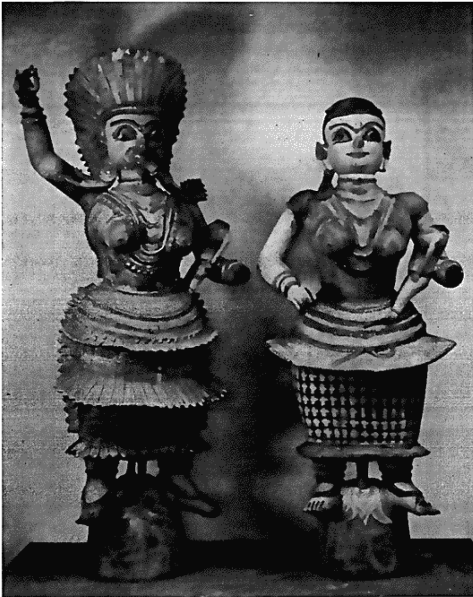
Fig. 2. Store votivfigurer forestillende gudinden Issaki. Travancore.