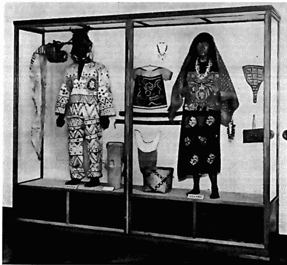
Fig. 1. Nyopstilling af maskedragt fra Guaymi og kvindedragt fra Cuna, Panamá.

delen er tilvejebragt ved bidrag fra vore videnskabelige fonds uden tilskud fra statens side.