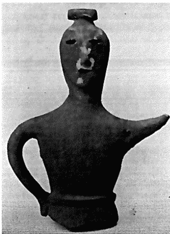
Fig. 3. Kvindefigur (haniwa) fra Yayoi-perioden. Japan.

østasiatisk kunst, vilde det for øvrigt befinde sig i en vanskelig situation; men heldigvis har det ofte med held kunnet henvende sig om støtte til sine velyndere. Det gælder selvfølgelig i første række Ny Carlsbergfondet og selskabet Etnografisk Samlings Vener. Også i år har der været rig anledning til at føle taknemlighed over for disse to institutioner, hvis redbonne hjælp det skyldes, at museet har været i stand til at indlemme fire prægtige malerier, nemlig tre kinesiske og eet formentlig koreansk, i sin østasiatiske afdeling. Det sidst nævnte forestiller en præst eller lærd, der er søgt ud i naturens stilhed, mens de andre er portrætter. De to af disse stammer fra Ming-perioden (1368—1644) og tilhører den gruppe, der betegnes som ying-hsiang , d. v. s. ceremonielle billeder, der i regelen er malet posthumt. De forestiller bægge højtstående embedsmænds hustruer, den ene civil af 3. rangklasse, den anden militær af 1. klasse, og udmærker sig lige så meget ved deres monumentale holdning som ved deres indtrængende karakteristik. Det tredje billede er lidt yngre og formodentlig et livsportræt, hsing-lé-t'u , forestillende en mandarinfrue af 1. rangklasse sammen med