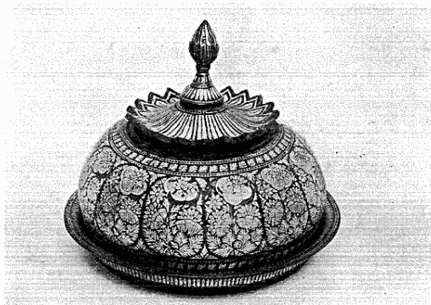
Fig. 3. Beholder med sølvindlægning. Bidri-arbejde, 16.—17. årh.