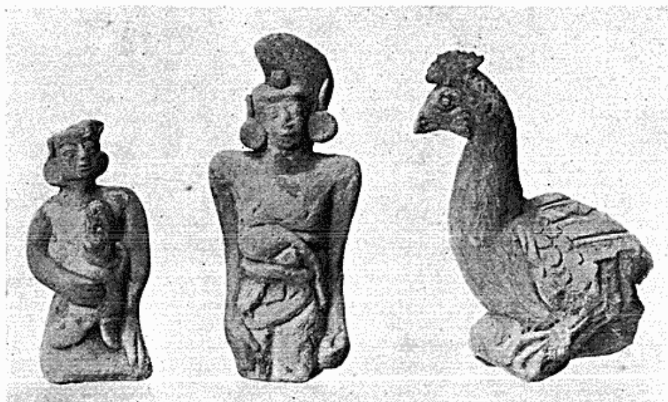
Fig. 2. Lerfigurer fra hindu-tiden. Java.

men også nogle dyrefigurer forekommer (fig. 2). Museet har fra tidligere tid nogle af disse sjældne stykker, men hverken så mange eller så fuldstændige som de nu erhvervede. Desuden omfatter den omtalte samling et par af de gamle, såkaldte Madjapahit-krise med fæste og klinge i eet stykke, flere hinduiske gudebilleder af bronze og enkelte nyere sager. Ved køb er der ligeledes indkommet nogle få genstande fra Philippinerne, en økse fra Sumatra er skænket af