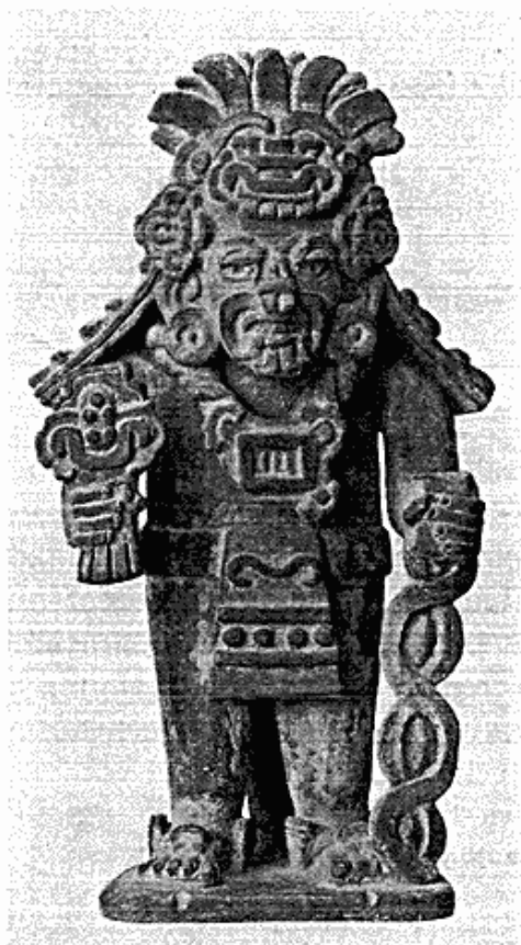
Fig. 6. Zapotekisk gravurne. México.

repræsentant Mogens Krause samt forskellige stenoldsager, der er indsendt fra Mineralogisk Museum sammen med de ovennævnte stykker fra Grønland. Bedre stiller sagen sig for de gamle, amerikanske kulturfolks vedkommende. Med Ny Carlsberg Fondets bistand er det lykkedes at erhverve dels en zapotekisk gravurne af