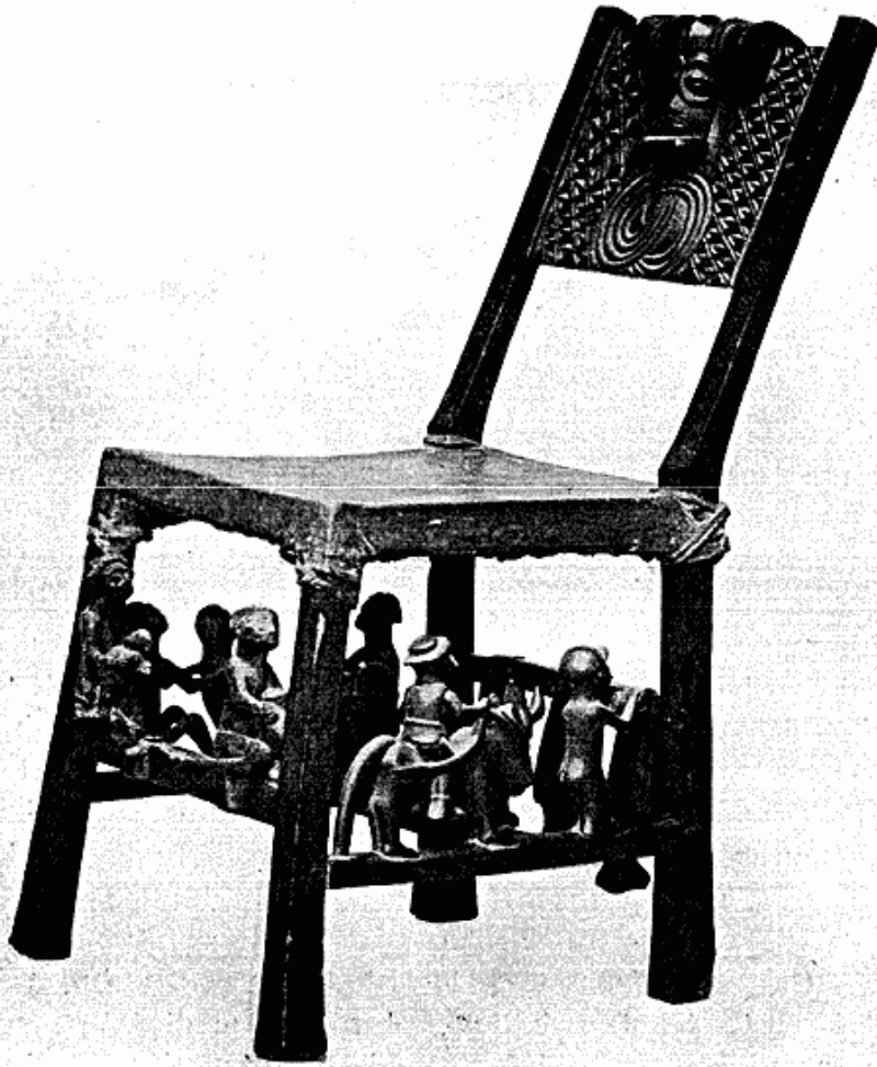
Fig. 4. Stol fra Batshioko, Sydvest-Congo. Blandt Fremstillingerne ses bagtil 3 Flagermus hængende med Hovederne nedad. Af Ny Carlsbergfondets Gave.

Genstande fra Indianerne ved øvre Xingú samt suppleret den desværre stadig meget ufuldstændige Samling fra Ildlandet.