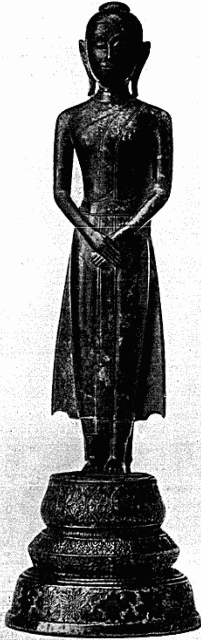
Fig. 1. Siamesisk Buddha udskåret i graagrøn Sten, staaende paa en Metalfod, indlagt med Emaille. 43 cm høj. Af H. kgl. H. Prinsesse Maries Samling.