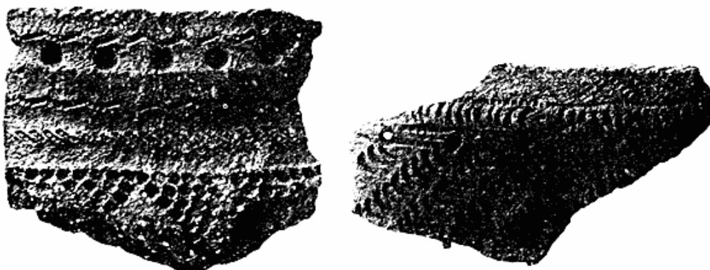
Fig. 1. Potteskår fra klitbebyggelsen (a) og hustomterne (b). Tiutei-Sale.

Både samojediske overleveringer og europæiske rejsebeskrivelser fra det 16.—17. årh. omtaler, at Barents og Kara Havets kyster fra Kola indtil Taimyr såvel som Vaigach, Novaya Zemlya, Belyi Ostrov o. a. øer tidligere var beboet af et folk, som i modsætning til disse egnens nuværende beboere levede af sødyrfangst og opførte