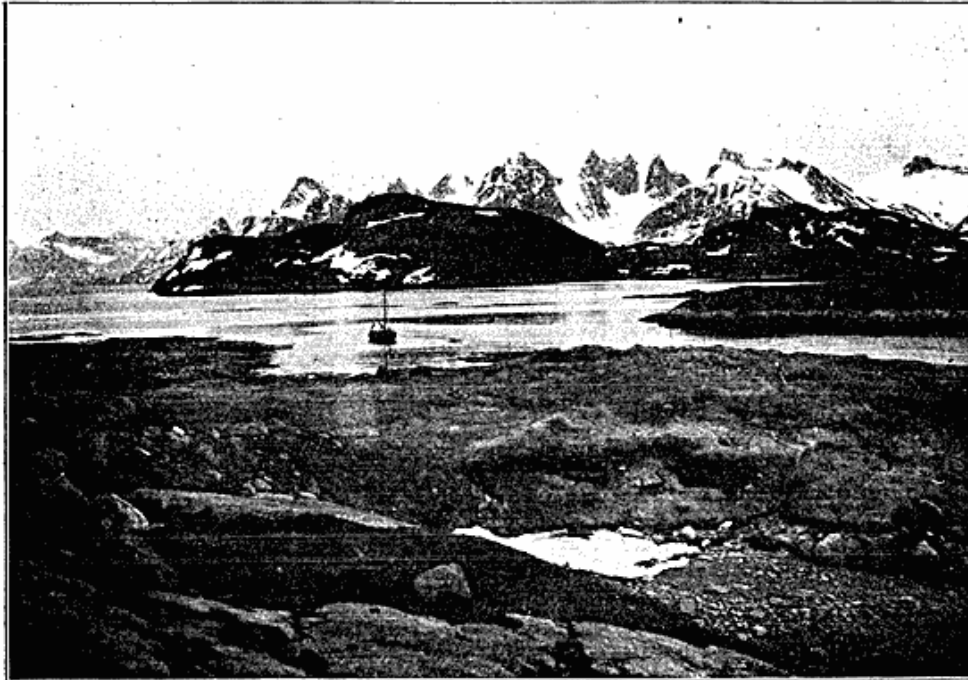
Fig. 1. Bopladsen Qeqertarmiut, hvor den største Udgravning foretoges. I Baggrunden Hamborger-landets Fjælde. Over Snedriven ses Møddingbrinken.

og desuden, et Stykke derfra, et Areal, ca. 30 \times 40 m, overgroet med en ualmindelig kraftig Græsvækst, det sikreste Tegn paa, at der er Kulturlag derunder. Dette viste sig at være en Mødding af meget betydelige Dimensioner, over store Arealer omkring 1\frac{1}{2} m tyk. Husruiner var der ikke at se; men ovenpaa laa fire ret moderne Teltfundamenter, lave, firkantede Græstørvvælde. Af denne store Mødding udgravedes et Areal paa ca. 260 Kvadratmeter, hvorved fandtes ca.