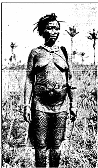
Kvindelig Høvding af Mokvanga-Stammen.

Disse Idéer er imidlertid i den senere Tid saa at sige overstemplede af vage Forestillinger om, at man kan opnaa, gennem Bøn og Amuletter, direkte Goder — og det er egentlig det første af Kristen-