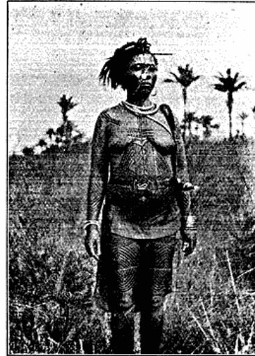
Tatoveret Balubana mifundi Kvinde

Balubaerne adskiller sig i en Mængde Understammer, tildels med forskellige Dialekter. Men Hovedforskellen dannes af Tatoveringen, der enten kan være i kongruente Mønstre som hos Balubana mifundi, eller blot uregelmæssige, ligesom planløst smaalhuggede Masker som hos Balubana tapo.