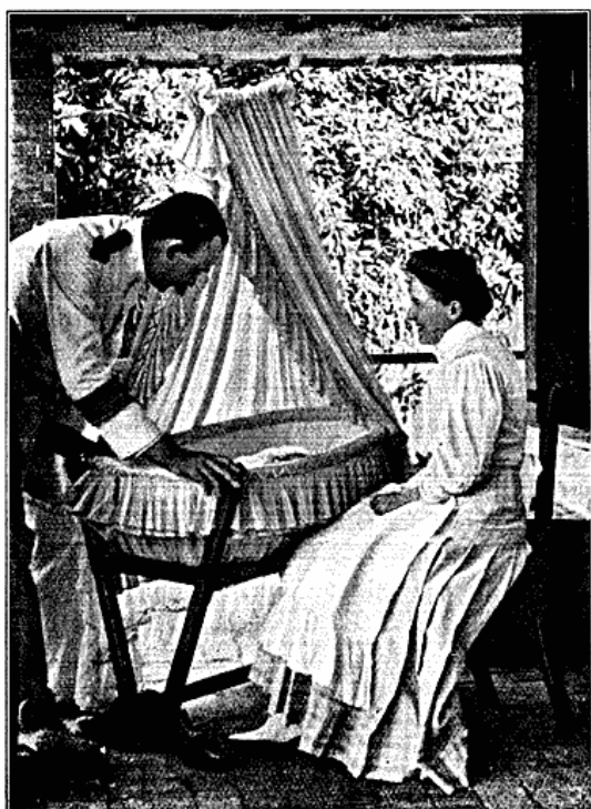
Europæisk Familieliv i Kongo.

I Batetelaerne har man en af de smukkeste og stolteste Stammer, der forøvrigt i det hele er stærkt paavirket af de arabiserede Negerfolk Øst for Lomamifloden. Det er et udpræget Krigerfolk, der ikke altid afventer, men ogsaa søger Anledning til Strid med Nabostammerne, som det er i høj Grad overlegen. Hvad der har gjort den yderligere frygtet, navnlig i den sydlige Del af Distriktet, er