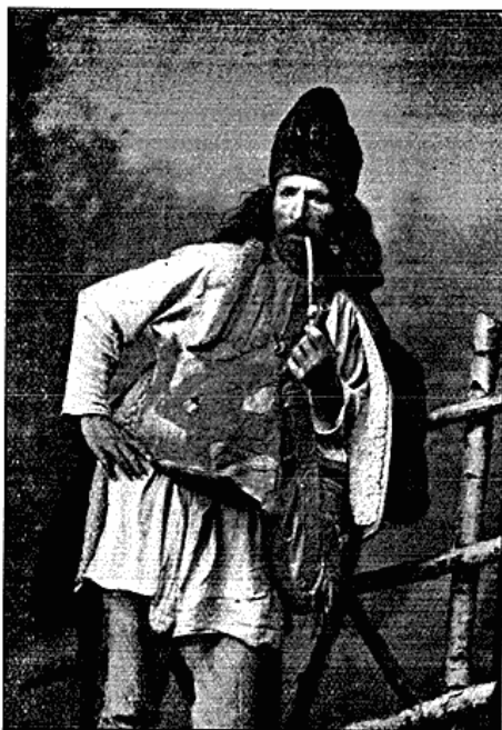
Rumæner fra de transsilvanske Alper.

Stina, synker Foden ofte i vaad Jord og Skarn, idet hele Pladsen er stærkt optrampet af Kreaturerne. Visse Plantearter betegner saadanne Lokalteter; jeg tænker herved især paa den lille Sagina procumbens og paa Rumex alpinus , en Skræppe med brede, rundede Blade. Midt i Hyttens store Rum blusser et Baal, som næres ved