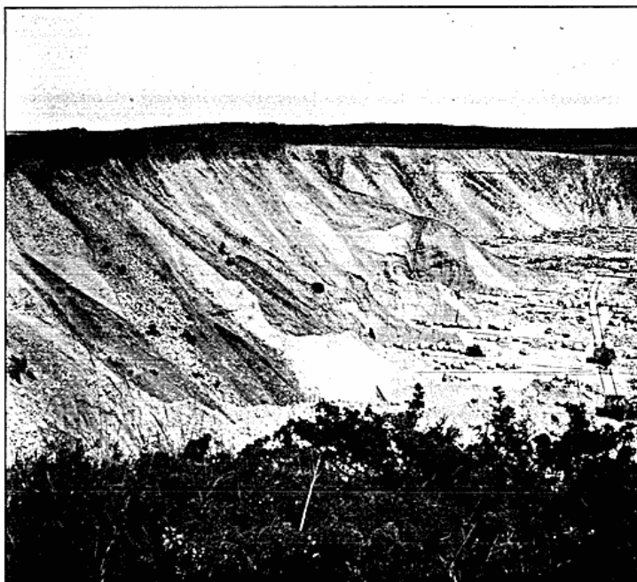
Fig. 5. Smeltevandsgrus. Glatved.

Disse spiller en overordentlig stor Rolle paa Djursland, hvor der navnlig strækker sig et bredt Bælte af Smeltevandsdannelser gennem hele Midten af Halvøen. Afløbsforholdene er ret komplicerede, da Smeltevandsfloderne stadig har fundet nye Veje, eftersom Isranden rykkede tilbage. De paa Kortet tegnede Flødløb refererer sig til Isens yderste Stilling; man vil se, at en mægtig Vandmasse passerer forbi Tistrup, Ryomgaard og Skaføgaard for at ende i Kattegattet udenfor Randers