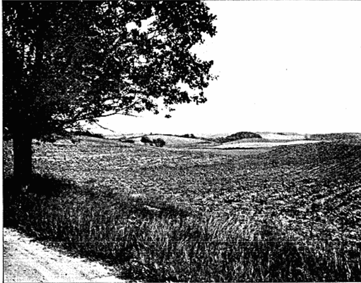
Fig. 3. Morænelandskab Øst for Kalvo.

Ogsaa fra denne Del af Isranden udstrømmede