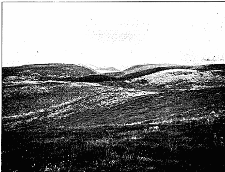
Fig. 4. Randmorænelandskab. Mols Bjærgs Øst for Agri.

Mægtighed, og har følgelig kun kunnet aflejre forholdsvis lidt Materiale. Fra Hylke til Skaarup findes en sammenhængende Vold; herfra til Aarhus Dalen findes derimod ingen udprægede Randdannelser. Nord herfor, indtil henimod Hestehave udgøres Isranden og Partierne