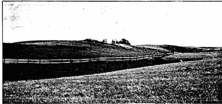
Fig. 1. Voldformet Randmorenebakke Syd for Nim.

en Del Smeltevandsfloder ud fra Isen. Da denne spærrede dem ude fra Kattegattet og Vejle Fjord, og den jyske Højderyg hindrede dem i at løbe mod Vest, var der ikke anden Mulighed for dem end at søge mod Nord, og saaledes fremkom det Fænomen, at Vandet lige fra Engene saa tæt ved Vejle Fjord, maatte og endnu i Dag maa løbe helt til Randers Fjord, inden det