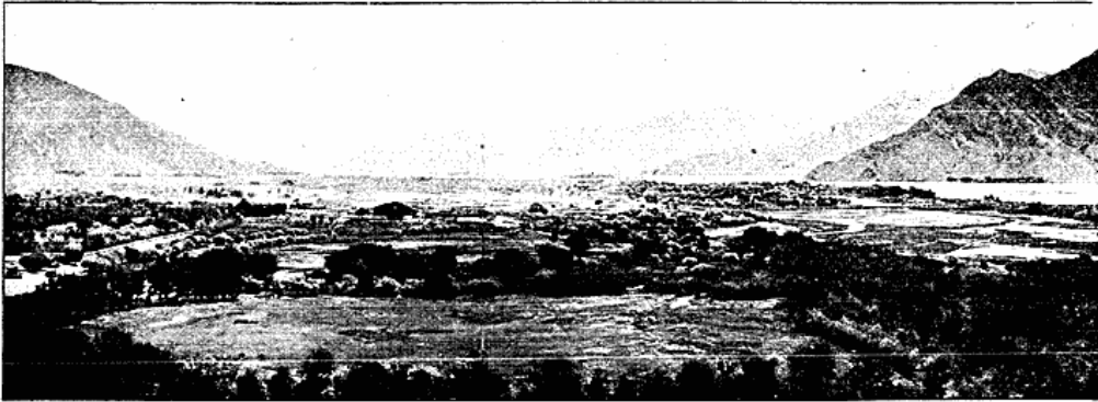
Panorama af Lhasa fra Ba-Mo-Ri.

byer, Klostre og Paladser, hvori Tibets Stormænd bor, og Lunde af Pil, Poppel, Valdnøddetræer, Fersken- og Abrikostræer er almindelige her. Dalsiderne var ogsaa vel dyrkede, og de høje Skraaninger, hvorpaa intet Træ saas, var dækkede med prægtigt Græs, som ernærede talrige Faar og Geder. Alt i alt var Landskabet smilende. Her mødte snart den ene, snart den anden Deputation fra Lhasa for at anmode Ekspd. om ikke at betrede Byen, og selve Dalai Lama sendte et Brev til Younghusband, hvori han meddelte, at hvis Ekspd. gik ind i den hellige By, vilde den lamaistiske Religion blive ødelagt og Dalai Lama selv dø. Ikke desto mindre hastede Ekspd. i stor Spænding videre mod Lhasa, idet enhver var ivrig efter at faa det første Glimt af den i Sigte, og endelig den 2. August saa man Potala Paladsets gyldne Tag glimre i Afstand for den næste Dag at kampere under dens Mure.