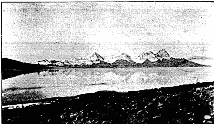
Soen Bamtso og Butankæden.