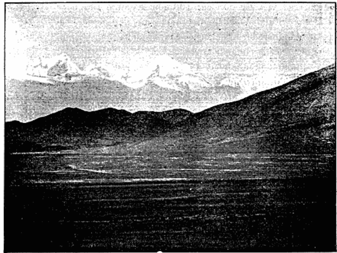
Mount Everest, set fra Khambajong.

voksende til henad Em., og nu kom mægtige Skymasser svævende ind fra Indien, Sue faldt undertiden; tilsidst indhylledes alt i Sne, og Skildvagterne havde om Natten Møje med at holde sig oprejste i den hylende Storm og det stærke Snefald. Kulden tiltog betydeligt, og hele Januar, Februar og Marts vedblev den bidende Vind, ledsaget nu og da af Sne. Efterhaanden som Ugerne gik, steg alter Temperaturen, og i April afmarcheredes der til Byen Gjangtse. Dalen her omkring er c. 8—10 Km. bred, overalt opfyldt af blomstrende Landsbyer og gennemskaaret af Vandingskanaler. Rundtom ved alle Landsbyer og Kanaler voksende Pile og Popler. Den gennemtrængende Kulde i Tuna var nu forbi, det frøs en Smule om Natten, men Dagene var begunstigede af smukt Solskinsvejr. Freden blev her brudt af Tibetanerne, der angreb Ekspeditionen, men blev slaæede.