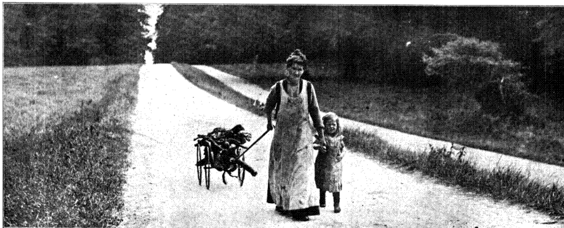
Et Læs Pindebrønde hentes hjem fra Skoven.

Passager Afdelingen, Kongens Nytorv 8, Kbhvn. K. Telf. 4700, og af de befuldmægtigede Agenter i Provinserne.