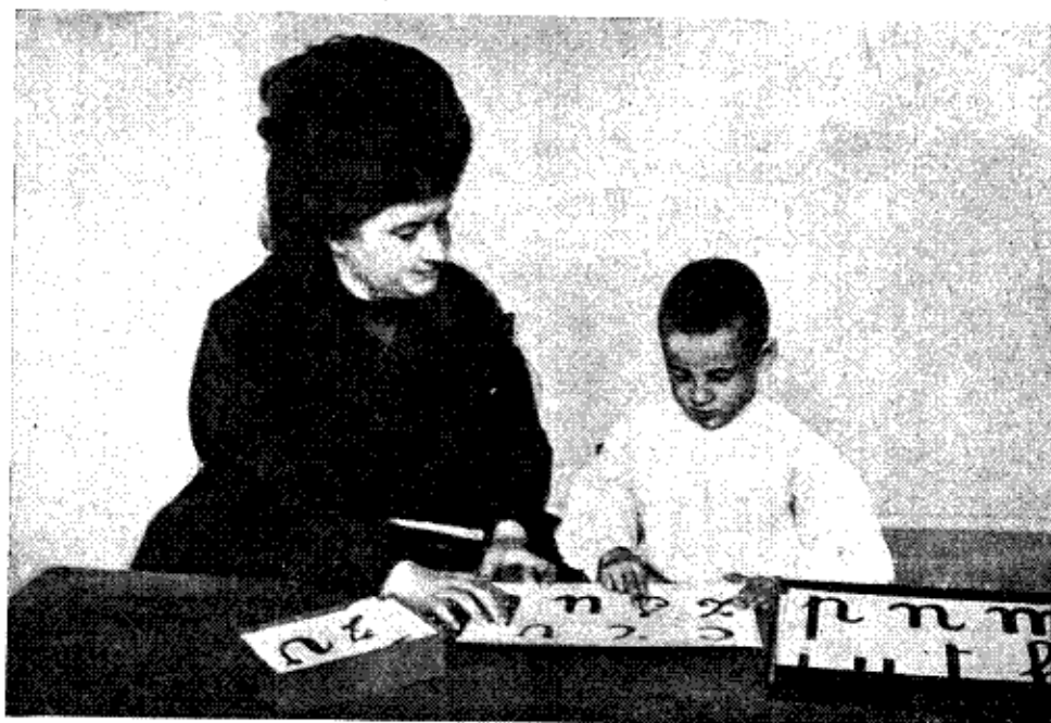
Dr. Montessori viser en lille Dreng, hvorledes han skal føle Sandpapirsbogstaver.

Dr. Montessori vil saaledes indrømme, at de moderne Skoler i mangt og meget langt overgaar de gamle; men de er dog alle bygget, som om de kun skulde være for os selv. F. Eks. er baade Vinduer og Døre, Borde og Stole alt for svære at tumle for en lille Barnehaand, ligesom Knagerækkerne som Regel er anbragt alt for højt oppe.