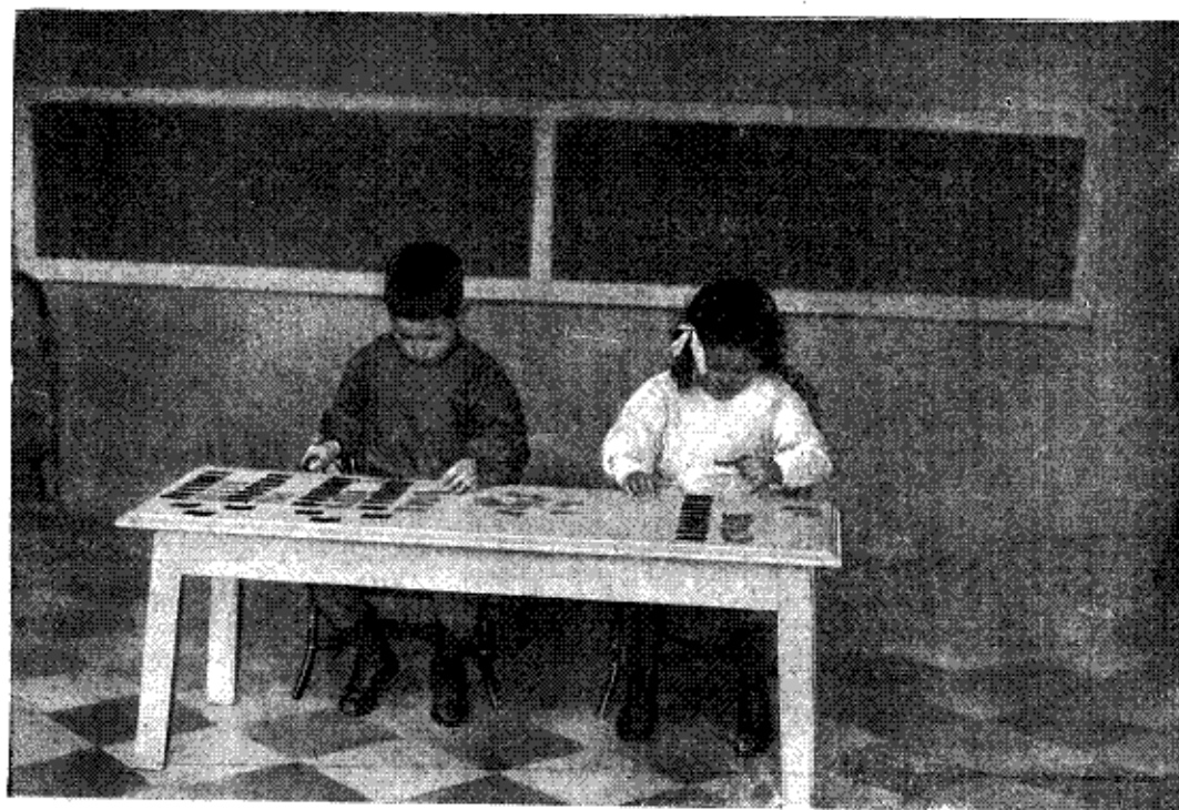
En lille Dreng og Pige hører Verber.

Ret beset er det i Grunden kun Klæderne, Folk tænker paa at faa tilpasset efter Barnets Alder og Størrelse. Vi gaar langt videre i vore Bestræbelser paa at skabe Forbedringer og gode Vilkaar for vore fængslede Forbrydere, medens der for Børnene er langt større og vigtigere Opgaver, der venter. Børnene er udsat for en Til-sidesættelse, som absolut bør afhjælpes.