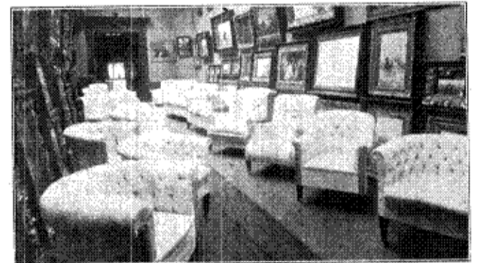
Nordisk Kunst- og Møbel-Etablissement's Udstillingslokale Nørregade 41. — 2. Etage. — Den lille Sal. — Sidebyg. th.