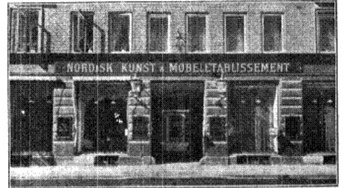
Nordisk Kunst- og Møbel-Etablissement's Ejendom Nørregade 41. — Gadefacaden med Udstillingsvinduerne.

EFTER HENFLYTNINGEN FRA AMAGERTORV 11 i 1917