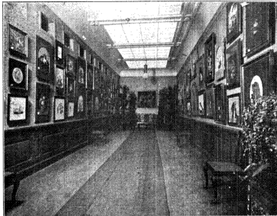
Nordisk Kunst- & Møbel-Etablissement's Udstillingslokale Nørregade 41. 1. Etage. — Ovenlyssalen. — Sidebygningen til venstre.