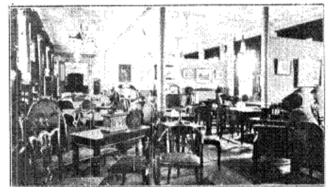
Nordisk-Kunst- & Møbel-Etablissement's Udstillingslokale Nørregade 41. — 2. Etage. — Den store Sal. — Bagbygningen.