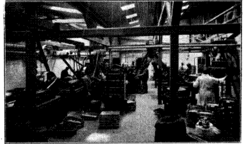
Parti af Maskinhallen.

Fabrikens Særopgave er først og fremmest at optage Konkurrencen med de udenlandske fine Chokolader, navnlig de fine Spisechokolader. Denne Opgaves Krav er ret store, fordi mange udenlandske Fabriker støttes af Eksportpræmier og i Virkeligheden betænker os herhjemme med deres Overproduktion til de lavest mulige Priser; og Fabrikken Luna har derfor tagt Kampen op paa en Maade, der er udpræget »fair play«, nemlig paa Grundlag af Kvaliteten , saaledes at