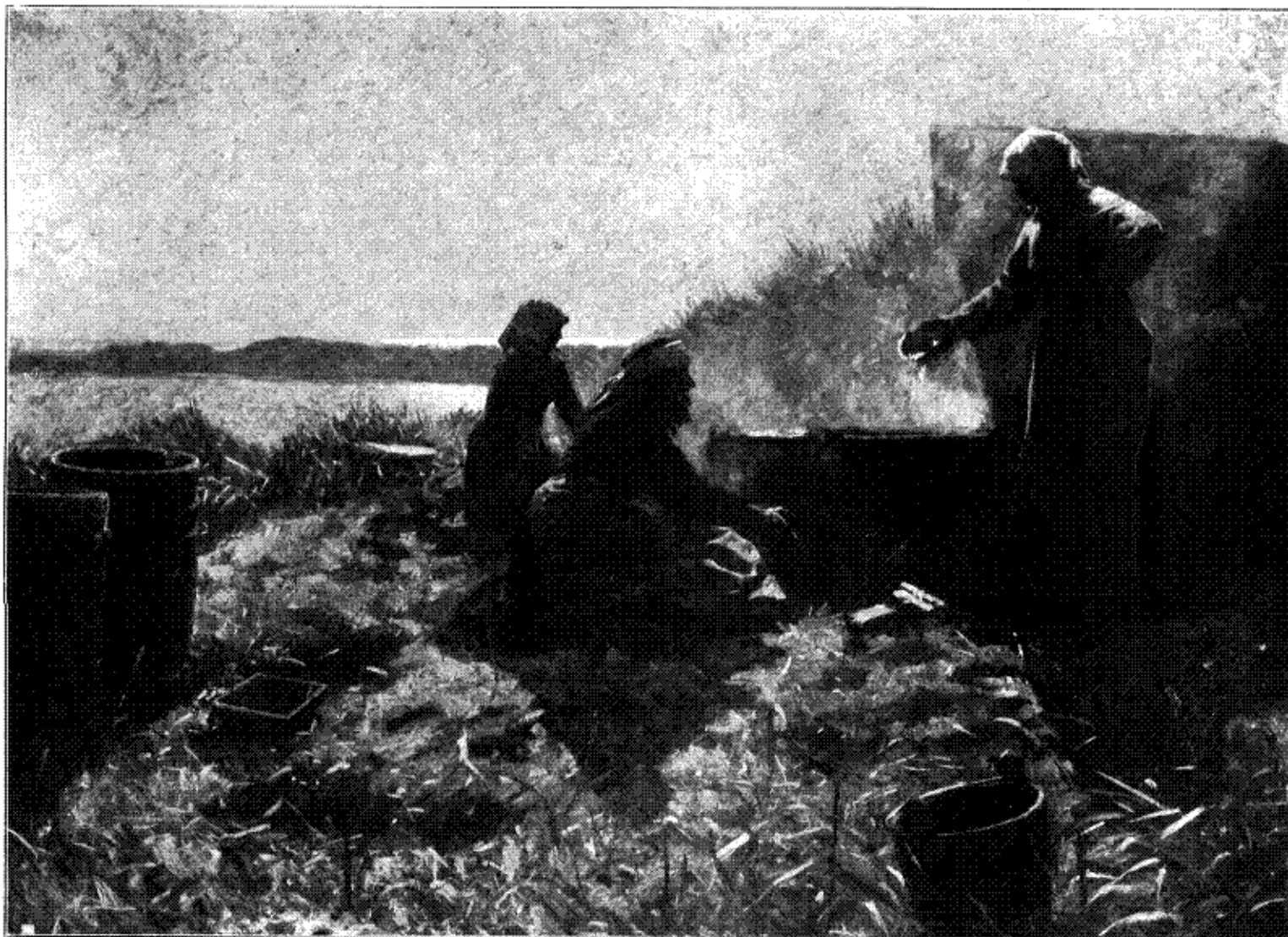
L. TUXEN: TRANKOGNING VED NYMINDEGAB