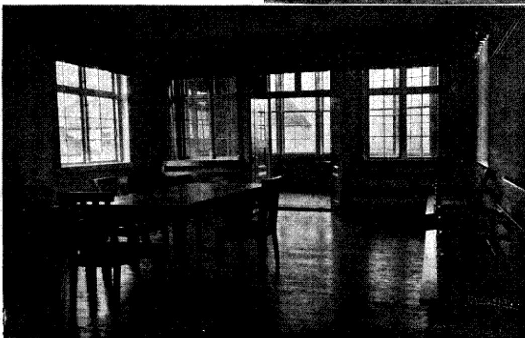
Dagligstue paa Anstalten

Indvielsen af den store Anstalt fandt Sted Tirsdag den 5. ds. med stor Højtidelighed.