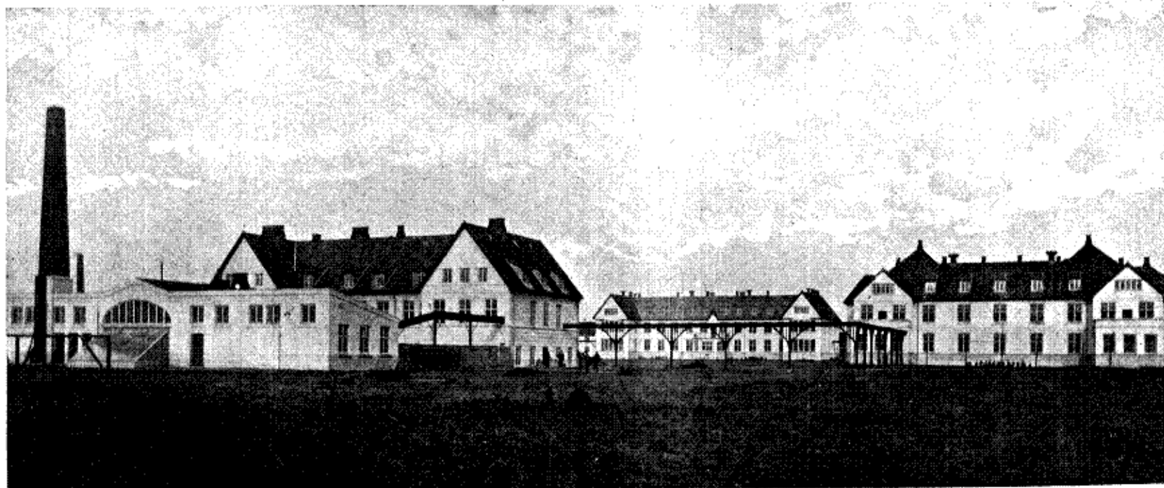
Aandssvageanstalten ved Ribe