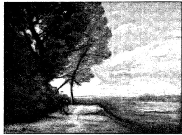
LANDSKAB AF COROT (Litografi af Repholtz)