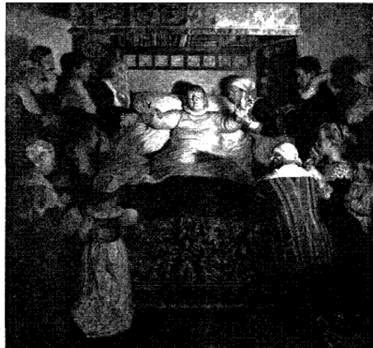
ZAHRTMANN: ELEONORA CHRISTINES DØD (Af Zahrtmann-Mappen)

Der er da nok at se og glædes ved i de stilfulde og elegante Lokaler, der giver udmærket Kunst en Indfatning, den fortjener.