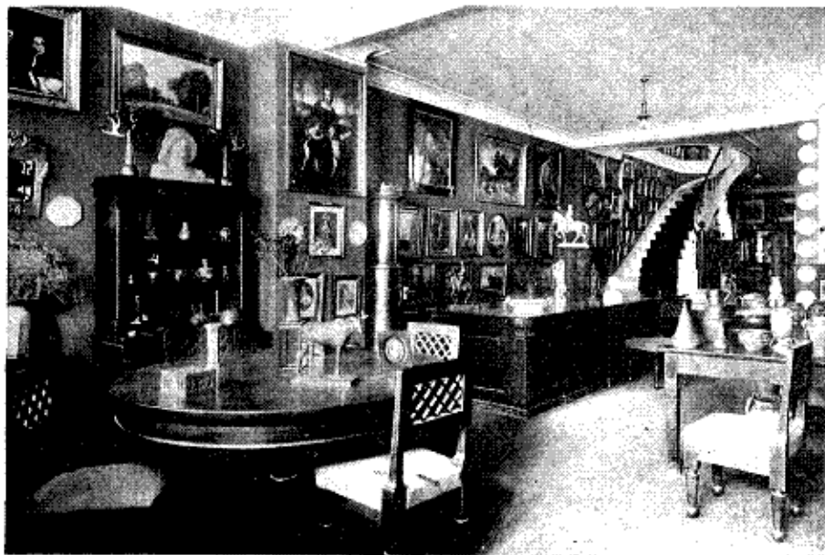
INTERIØR FRA WINKEL &amp; MAGNUSSENS KUNSTHANDEL.