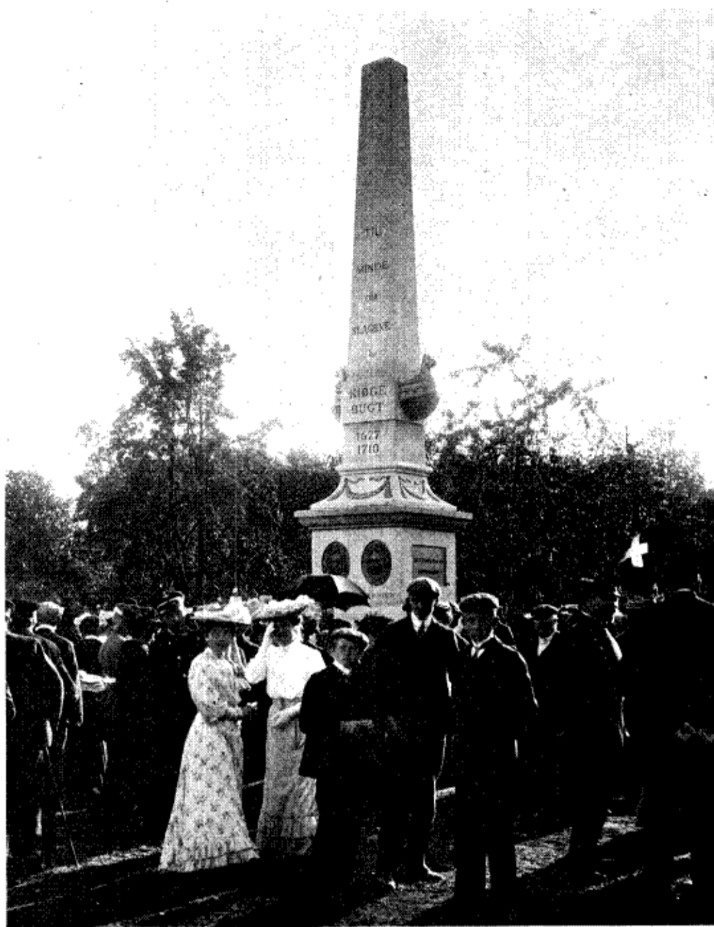
MINDESMÆRKET FOR NIELS JUEL OG IVAR HUITFELDT PAA KØGE HAVNEPLADS