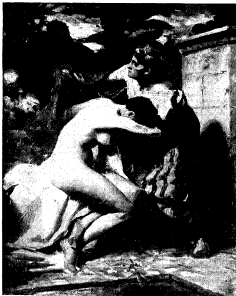
Laurits Tuxen: Skitse til Susanne i Badet (1878)