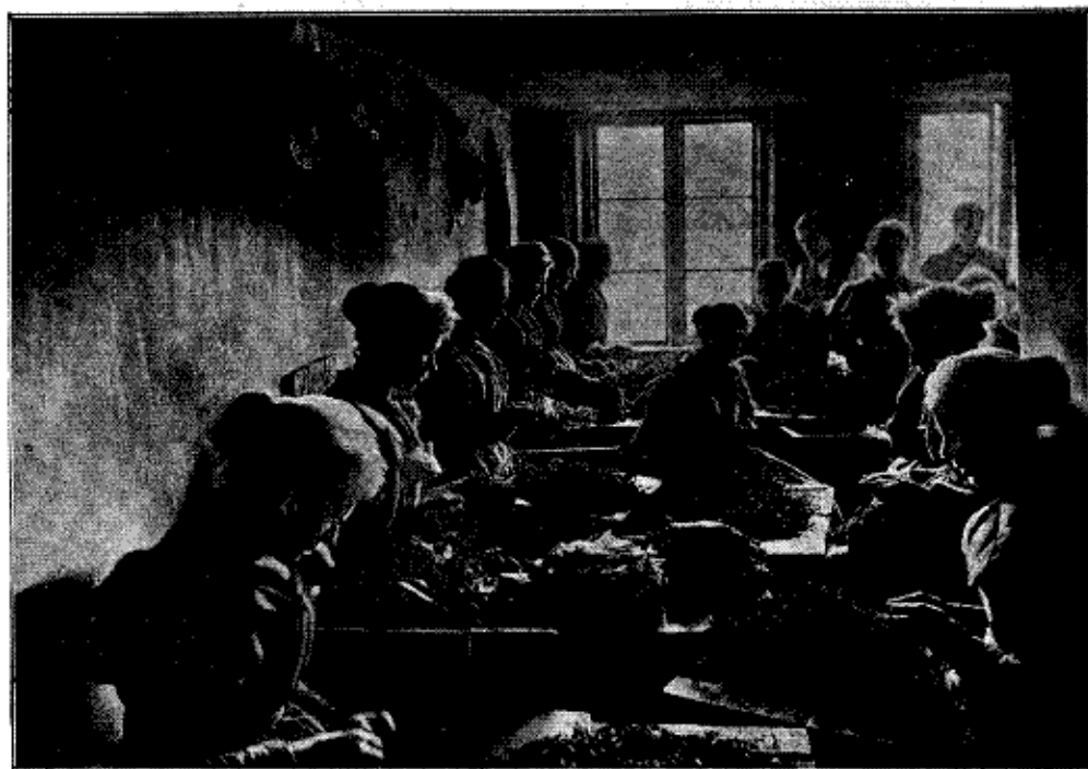
En af Strippestuerne.