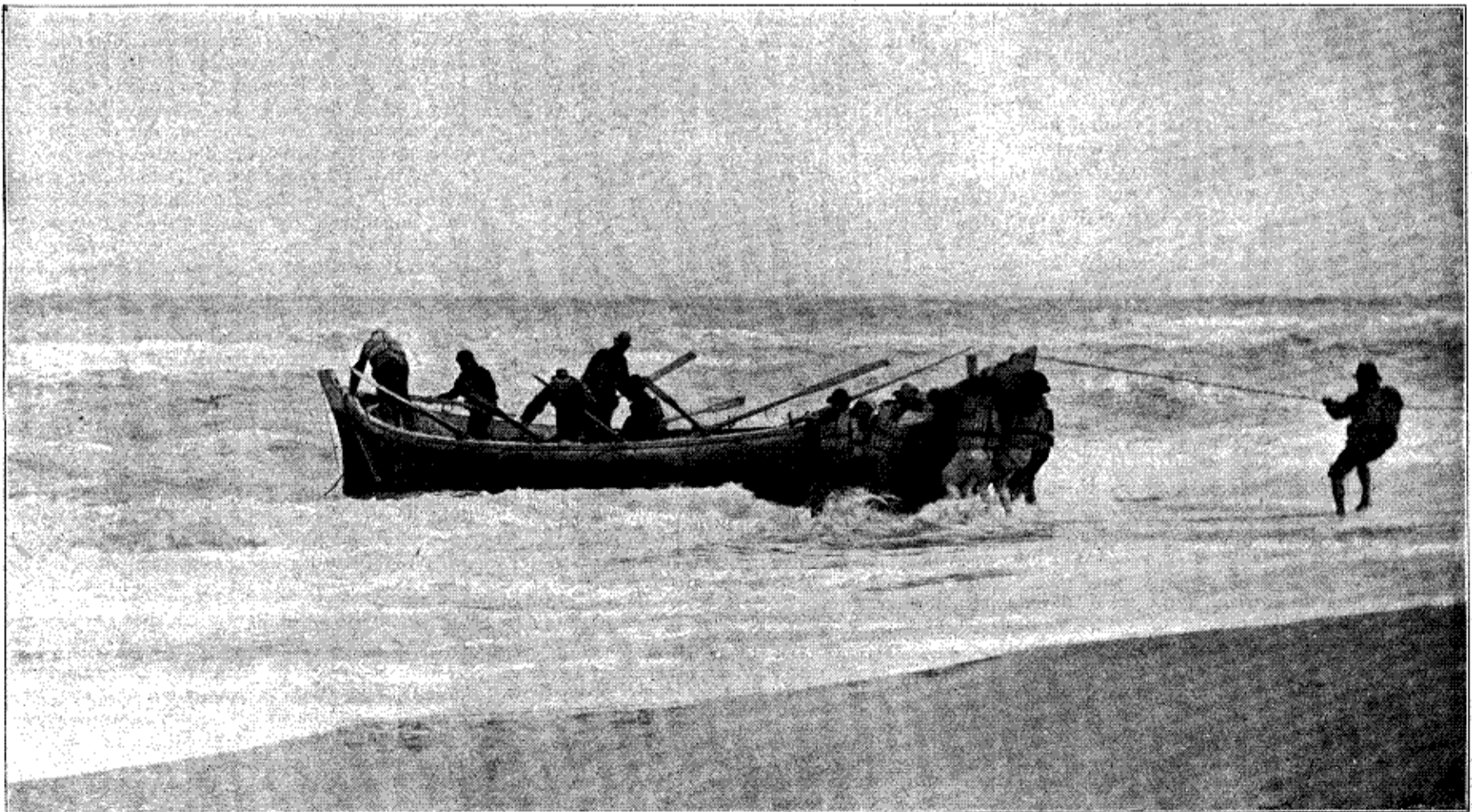
Redningsbaaden hales ind i Havstokken.