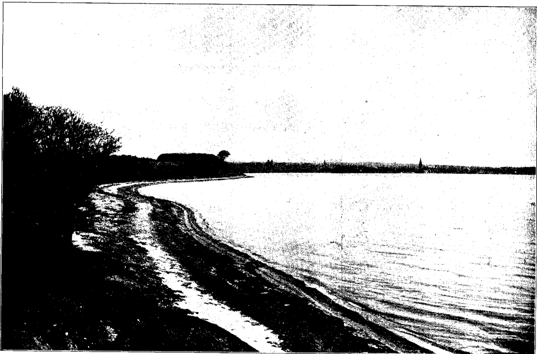
Udsigt fra Varna.

— Tarvelig og prunkløs som Gaard og Bolig strækker Marselisborg Have sig ned mod en lille Eng og Udhugning i den første af Godssets Skove, »Ladegaardsskoven«, »Forskoven« eller »Friheden«. Men her er det forbi med Tarveligheden; der bliver intet andet Udtryk end pragtfuld for den Park, der omslutter det lille Herresæde i det store Gods. Brede om Lænd, ranke i Ryggen ere de, og knejsende Kroner have de, Bøgetræerne i Marselisborg Skove. Stoute og værdige staa de i Rad og Række, medens Bunden tæpper sig med grønt, hvori blege Anemoner hvile, hvide og røde Hane-kamme kro sig, og Guldstjerner tændes. Men ude i Skov-