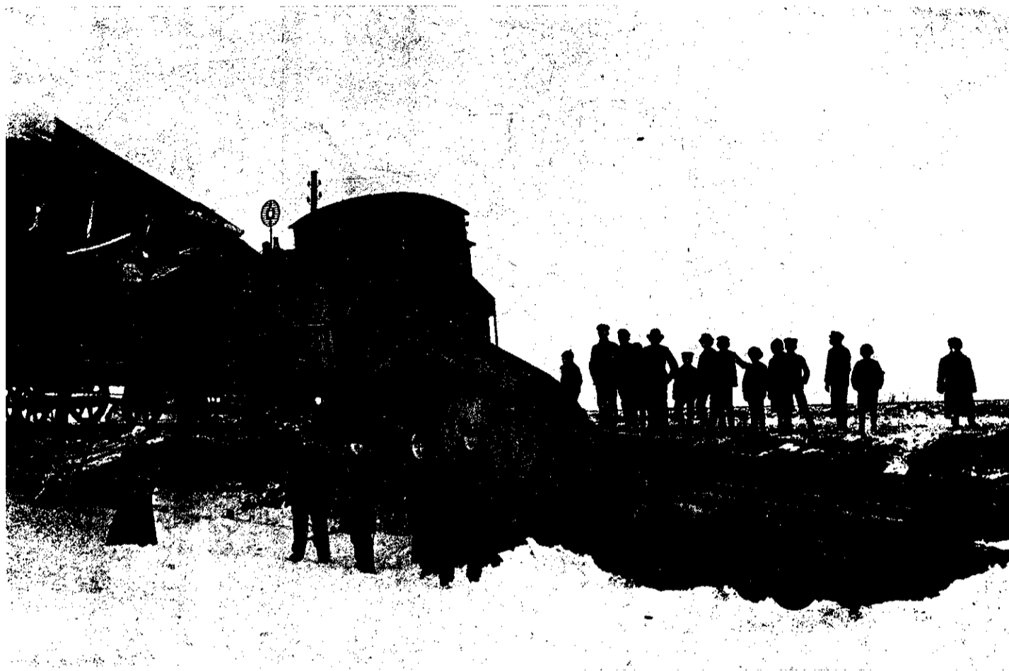
Fra Togulykken ved Vamdrup. Efter Fotografi.

Tog- og Lokomotivføreren blev kastede langt