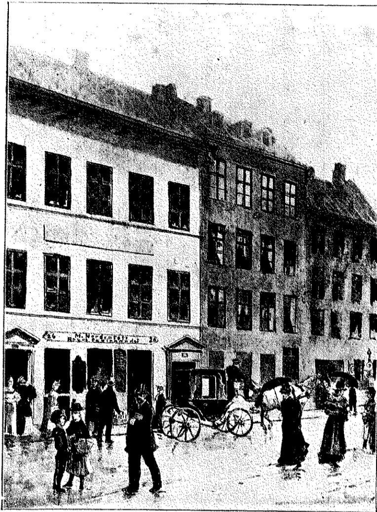
Den tekniske Skole i Læderstræde.