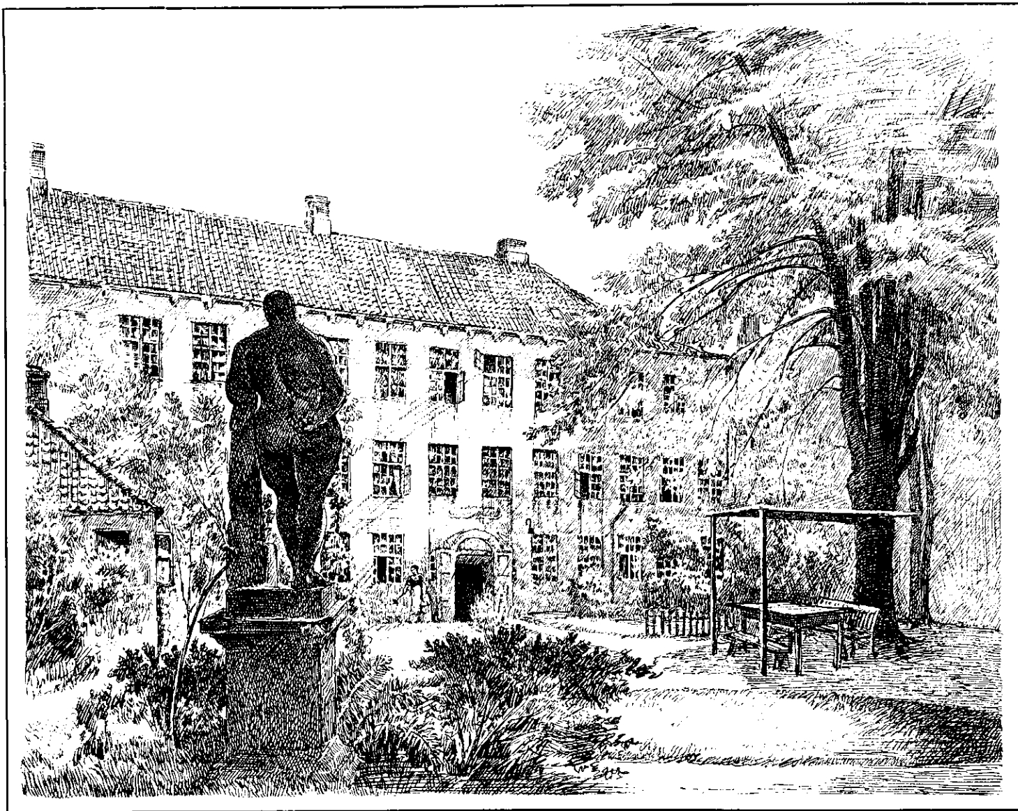
Det nuværende Borchs Kollegium set fra Haven med Herkules-Statuen.

Ved Københavns store Ildebrand 1728 blev Borchs Kollegium helt ødelagt; kun Sølvkrucifixet og Borchs Billede blev reddede. Da Kollegiet blev gjenopført, var det langt fra saa rigt udstyret. Arbejdsiveren synes ogsaa at være taget noget af; dog var der mange Alumnus, der senere fik et anset Navn i Fædrelandets Historie, som Sne-