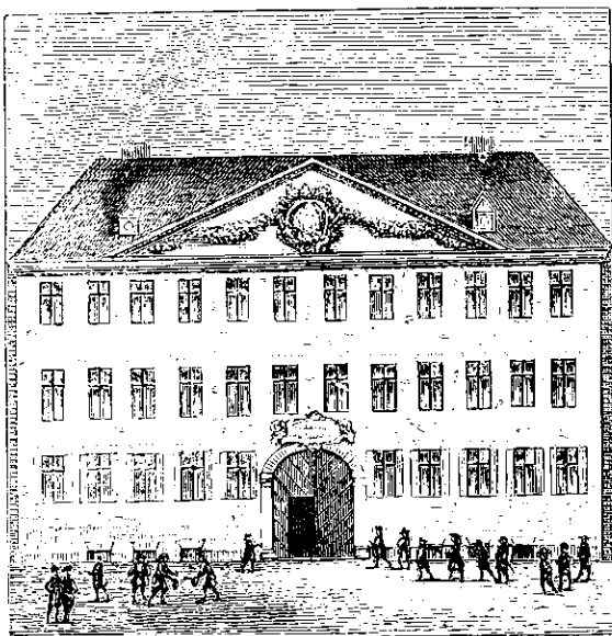
Borchs Kollegium i den ældste Skikkelse.

Borchs Kollegium eller »Collegium Medicum« er stiftet af den ansete Videnskabsmand Oluf Borch, der ved sin Lægevirksomhed havde samlet sig stor Formue. I sine ældre Aar skal han have tænkt paa at gifte sig og forlovede sig med en ung Pige; men hun tog ham kun for Pengenes Skyld, og da han tilfældig i et Spejl opdagede, at hun bag hans Ryg efterabede hans haltende Gang, brød han med hende og slog saa Giftetankerne af Hovedet. Denne senere Fortælling, der er benyttet af Chr. Winther i Novellen »En Aftenscene«, kan ikke kaldes ubetinget tilforladelig; men sikkert er det, at Borch forblev ugift og saaledes des bedre var i Stand til at grunde sit Kollegium. Han købte en forfalden Professorbolig i St. Kannikestræde, lod den nedrive og en stor, statelig Bygning opføre til Bolig for 16 »gudfrygtige og lærde Studiosi.« Den 20. Juli 1689 undertegnede han Fundatsen, der fastsatte Lovene for Kollegiet; men inden hans Plan var helt udført, bukkede han under