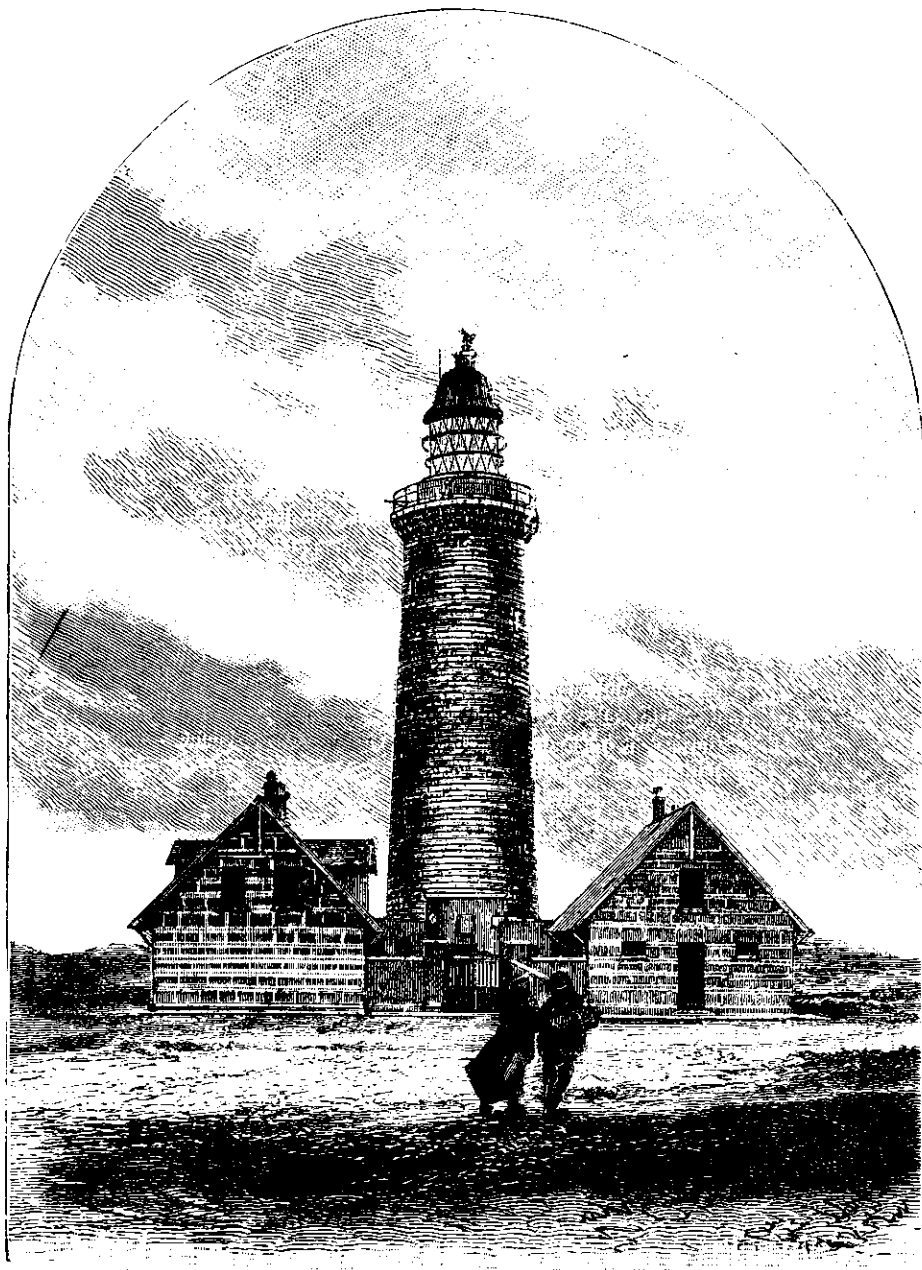
Det nye Fyrtaarn ved Lodbjerg.

nøjagtige og hurtige Udførelse af en Mængde Enkelt-heder i methodisk Rækkefølge, af hvilke en hel Gruppe kun er antydnet her, nemlig alle de, der gaa ud paa at forene og atter afbryde de elektriske Forbindelser, hvilket foregaaer ved en sindrig Anbringelse af nogle smaa saakaldte »Propper« paa bestemte Steder af de hinanden under rette Vinkler krydsende Ledningsskinner, som bedække Operationsbordenes Overflade. Hvert Bord har 50 Abonnenter at betjene, selvfølgelig ordnede numerusvis: 1—50, 51—100 o. s. v., og den hele Expedition udføres af ligesaamange Damer, som der er Borde, en til hvert, under Ledelse af en Inspektrice. Tjenesten kan være anstrengende nok, og Lønnen maa vi vistnok kalde beskednen i Forhold til de Fordringer, der skulle fyldestgøres — den er ialtfald betydelig ringere end Betalingen for det selvsamme Arbejdes Udførelse f. Ex. i Stockholm. Der er noget nerveust Oprivende ved denne idelige Agtpaagivenhed, denne Blanding af en Stunds uantastede Ro og et paafølgende Tidsrumms rastløse Sammenstilling og Afbrydelse af Linier, der Slag i Slag kalde paa hinanden. En samlet Hvile er en Nødvendighed for de unge Kvinder, der fungere i et af Telefonselskabets Centralbureauer, og Arbejdet er derfor fordelt saaledes mellem to Hold, at det ene har Tjeneste fra Eftermiddag til Aften den ene Dag og fra Morgen til