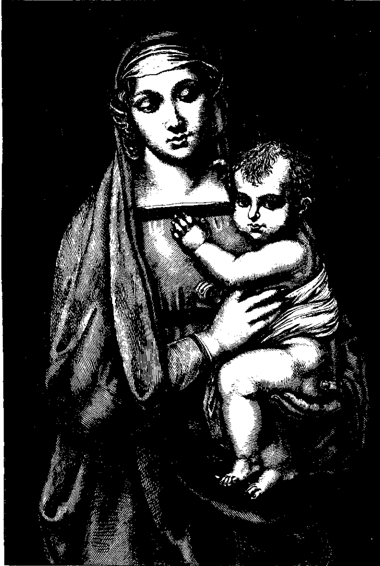
Rafael: Madonna del Granduca.

os til at se saa mange andre komme ind under Boldspilletets Omraade. Naar Saisonen er ude for Konstantinopels Vedkommende og den store Sværm af Besøgende er draget bort fra denne Stad, er der sørget for andre Overraskelser, idet samtlige Panoramabilleder ere skaarne over samme Læst og meget fornuftigt afpassede saaledes, at de kunne monteres fra eet Sted og med Lethed monteres paa et andet.