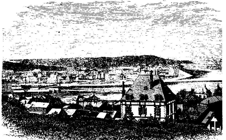
Trouville, seet fra Høiderne bag Byen.

efter det andet, og overraskede Pariserne paa næste Aars Udstilling med sine Partier fra Trouville og fra Touque. Malerens Pensel satte snart Pennene i Bevægelse, og saa begyndte Indvandringen.