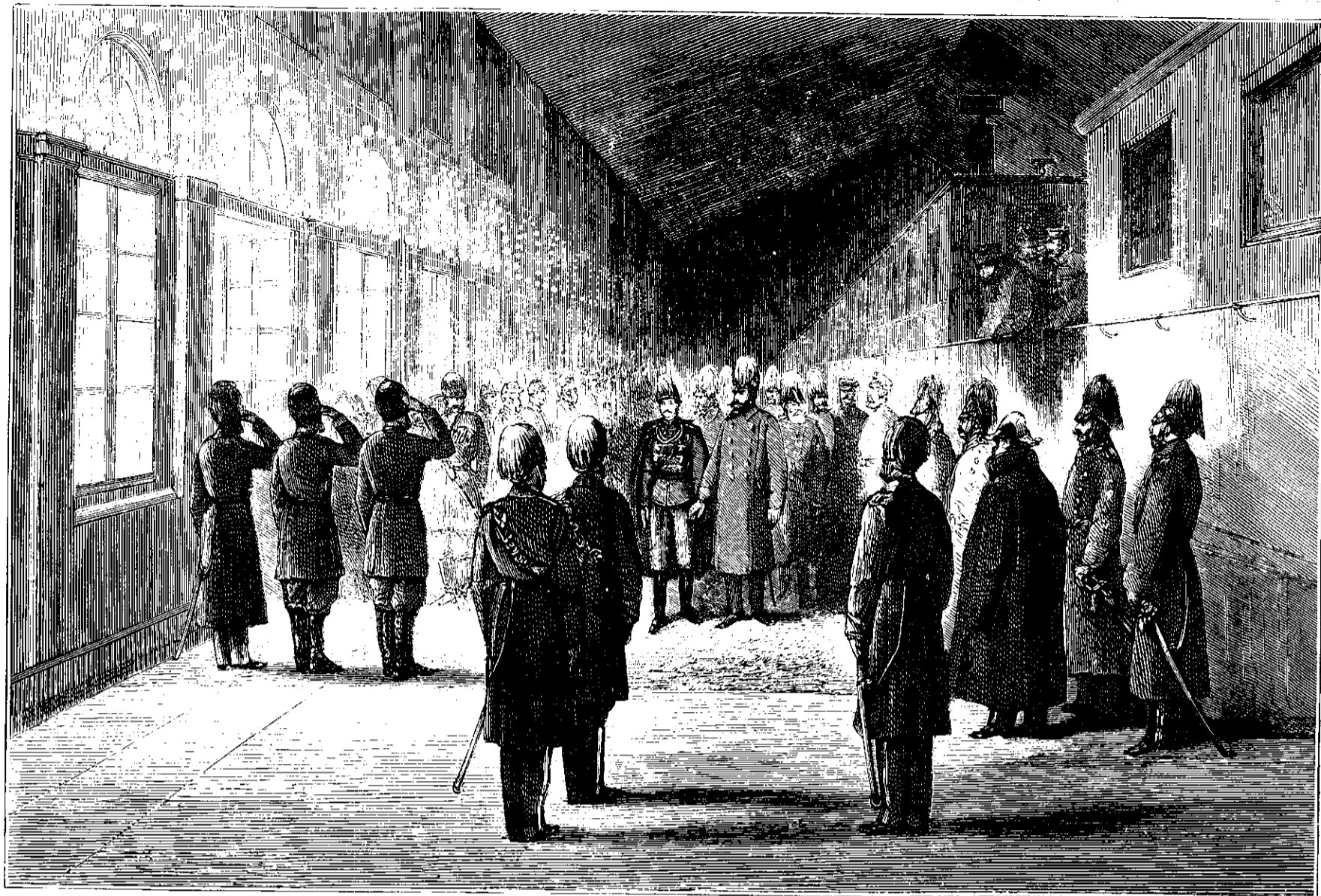
H. K. H. Kronprinds Frederiks Ankomst til St. Petersborg den 20 Januar 1874.

jeg en Fornemmelse af, at vi endelig havde naact | Tid, og ingen Skygger have formærket vort Hjem. i Børneflokk, som Fortællinger og Bedstefædre i ligo en sikker Havn. Ti Aar ere forløbne siden den | Jeg beboer den ene Fløi af Gaarden, og den | Grad ynde, er fuldtalligt tilstede. Min Hustru bliver