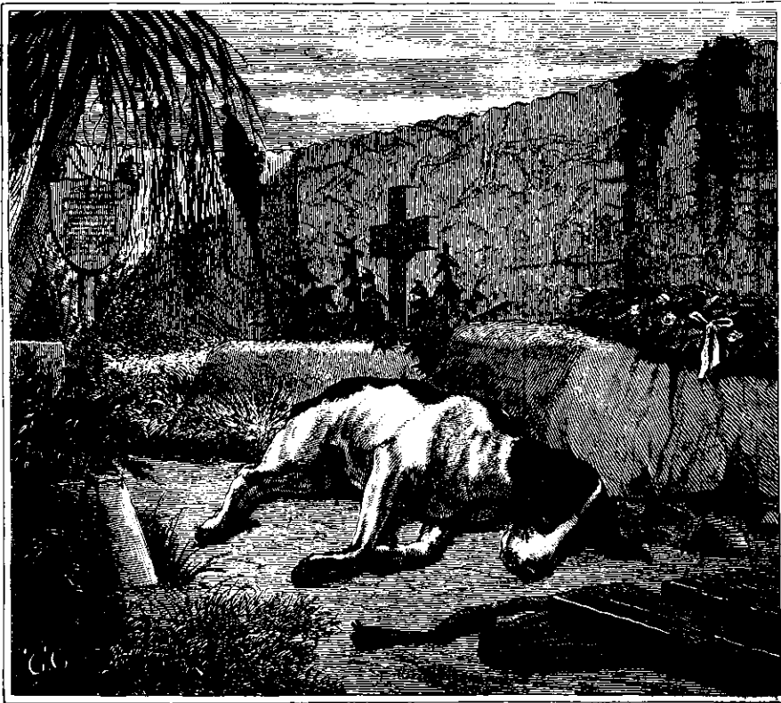
Chasseurs Liv og Levnet. IX. X. Tegnet af S. Simonsen.