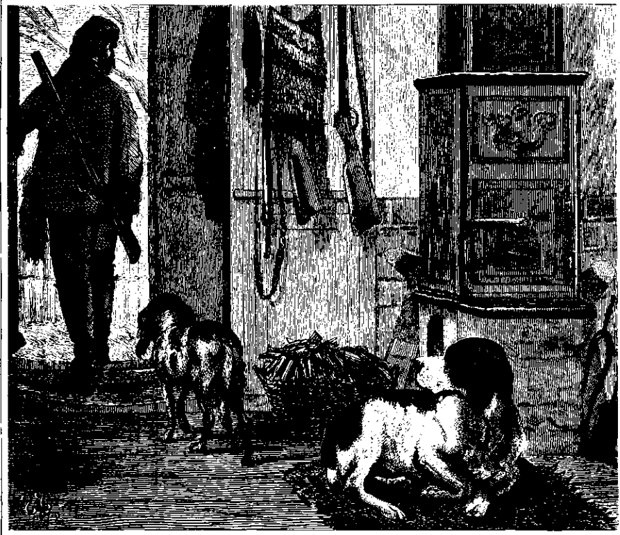
Chasseurs Liv og Levnet. VIII.

— Det er Peters Fødselsdag, og Onkel Henrik trækker ham derfor ind til Gianelli, stiller ham foran Buffeten og beder ham tage for sig af Kagerne, saa meget han lyster. Peter præsterer det Utrolige, og da Onkelen i en halv Time har seet paa hans ufortrødne Anstregelser, siger han endelig: »Hvor i Alverden kan Du taale at spise lutter Kager i saadan Mængde! Er Du ikke daarlig tilpas allerede?« — Peter holder inde med Arbejdet et Øieblik, vender sig halvt om og siger: »Jo, Onkel, jeg er rigtignok noget tørstig, saa dersom her var Chocolate —!«