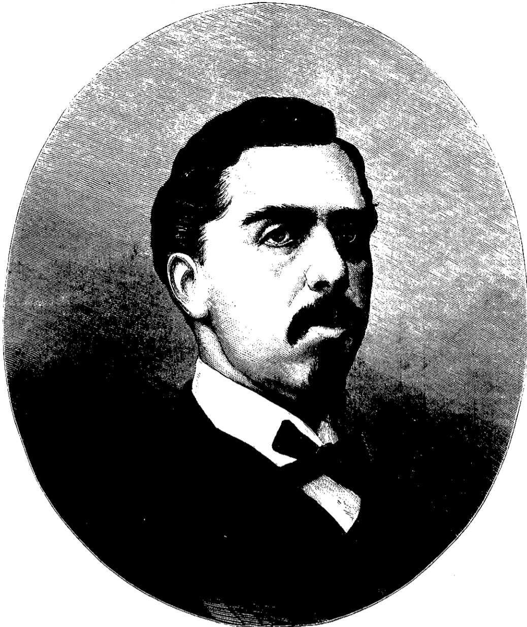
Den spanske Kronprætendent Don Carlos.

Den spanske Prinds Don Carlos eller Kong Carl VII, som han kalder sig, er født den 30te Marts 1848 og en Sønesøn af den sørgelig berømte Don Carlos, Ferdinand VII's Broder, der i syv Aar vedligeholdte en frygtelig Borgerkrig i sit ulykkelige Fædreland. Den gamle Don Carlos, der i 1839 flygtede til Frankrig og tog Ophold i Bourges, gav den 18de Mai 1845 Afkald paa sine Rettigheder til den spanske Throne til Fordel for sin ældste Søn, hvorefter han lod sig kalde Greve af Molina og begav sig til Østerrig, hvor han døde i Triest den 10de Marts 1855, efterladende sig tre Sønner. Don Carlos Luis Fernando de Bourbon, Prinds af Asturien, der siden 1845 havde været Thronprætendent, var født i Madrid den 31te Januar 1818 og antog efter sin Faders Død Titelen Greve af Montemolin. Som Prætendent var han Don Carlos II, som Konge hed han Carl VI, idet han heri efterlignede Ludvig XVIII og Napoleon III, der ligeledes lagde to Tal til deres Forgængeres paa Thronen, fordi de paa en iøinefaldende Maade vilde vise, at de Prindsere, der efter det sidste Thronskifte havde staaet foran dem, burde have baaet Kronen, naar Lov og Ret havde haft Gyldighed. Den gamle Don Carlos, der var en Søn af Carl IV, vilde have bestegit Thronen under Navn af Carl V,