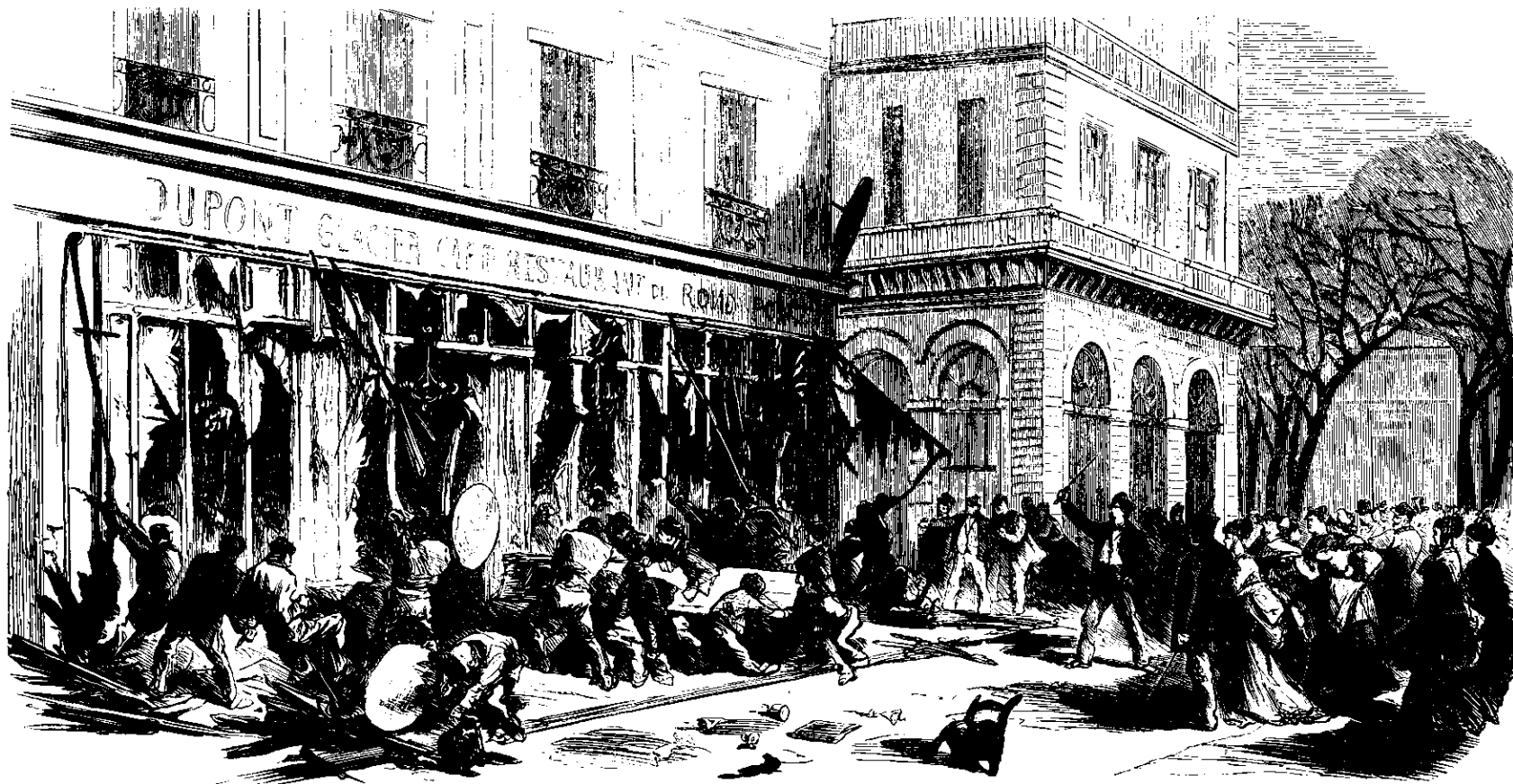
Ødelæggelsen af Cafen ved Rond-Point i Champs-Élysées efter Tyskernes Bortmarche.

ilde tilfreds efter ham. »At tilsidesættes for en gammel Jomfrues Skyld som Tante Daisy! Hun har vist Penge. Ak, hvad vilde jeg ikke give til, at jeg var rig!«