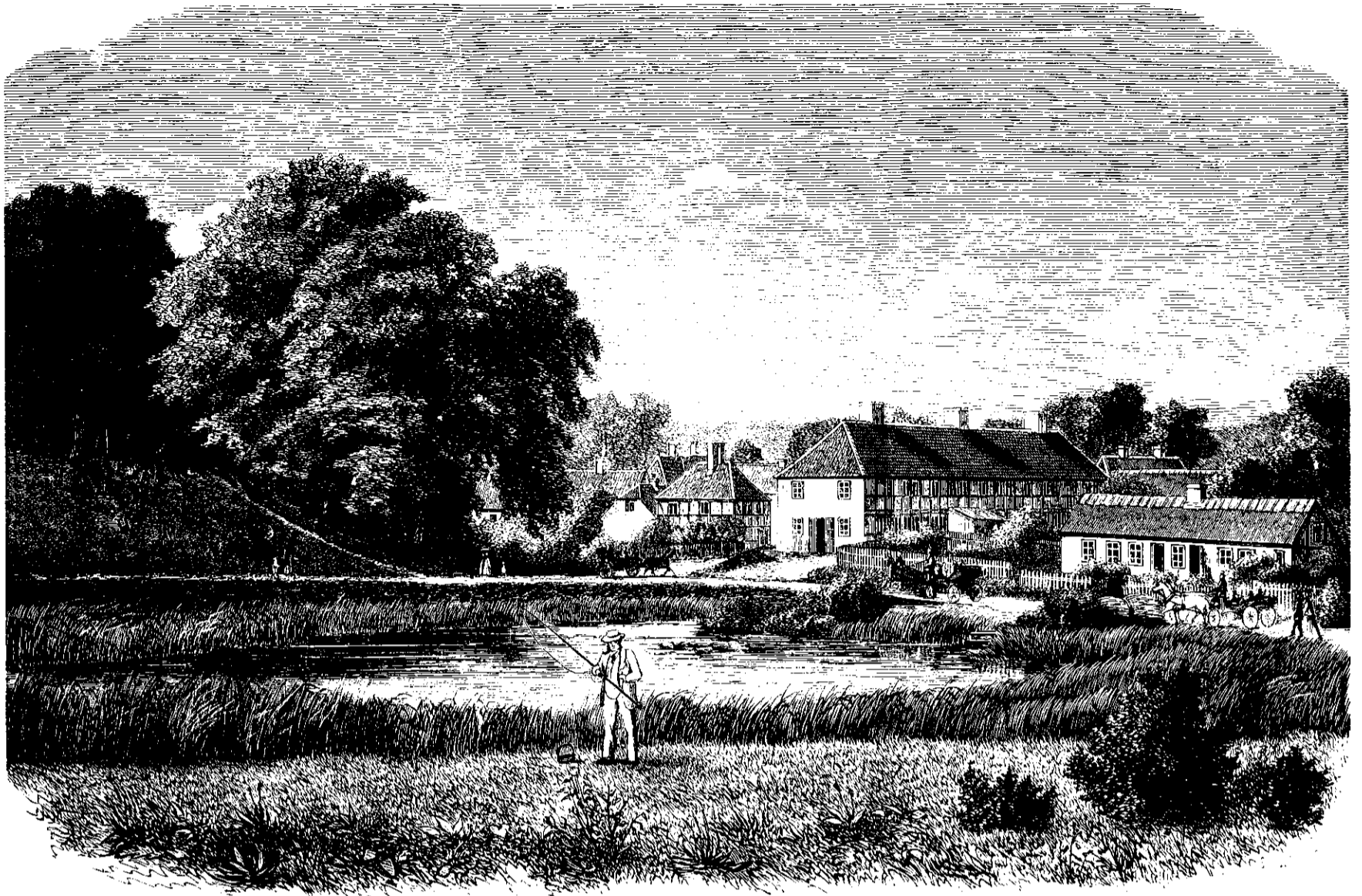
„Hleværket“ i Dyrhaven. Tegnet efter Naturen af G. E. Libert.

men jeg gjentager det paany, jeg var aldeles ikke forbauset. O Gud, havde jeg dengang vidst, hvad jeg siden fik at vide, havde det været mig let at forklare denne Modsigelse i mine Følelser.