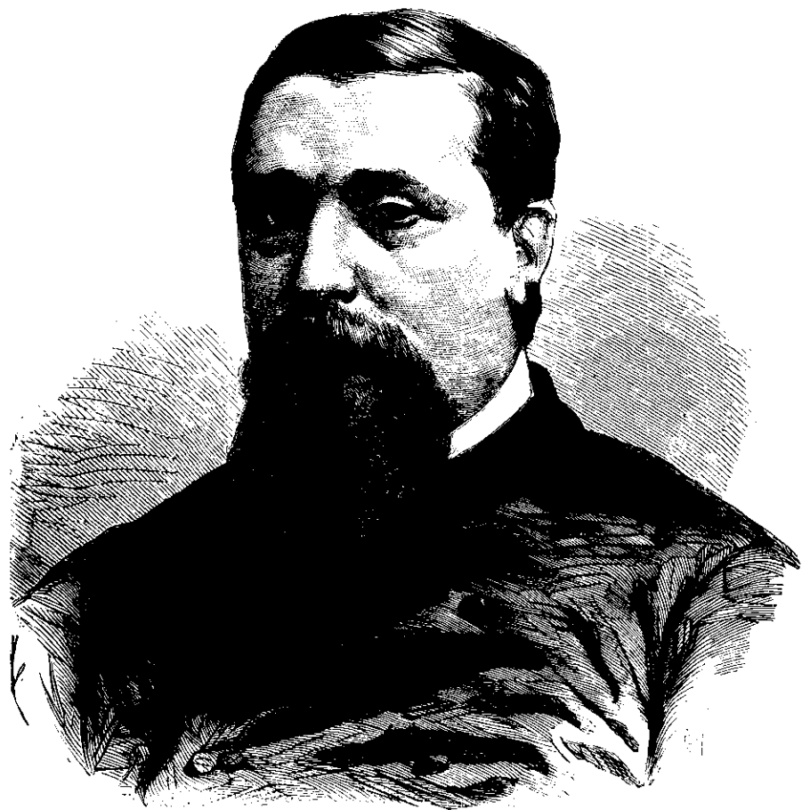
Prinds Pierre Bonaparte.