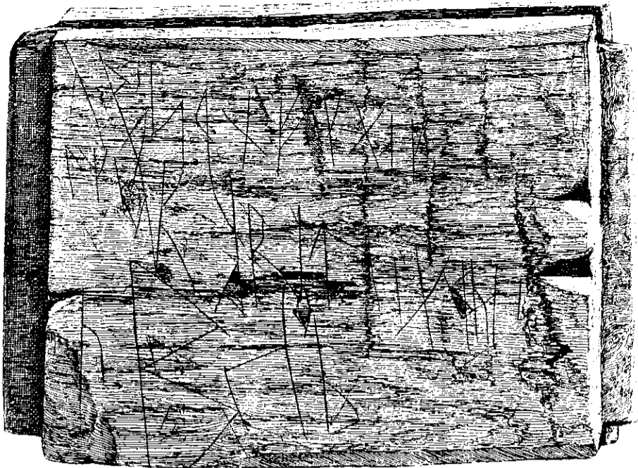
Et i en islandsk Stol fundet Runealfabet.