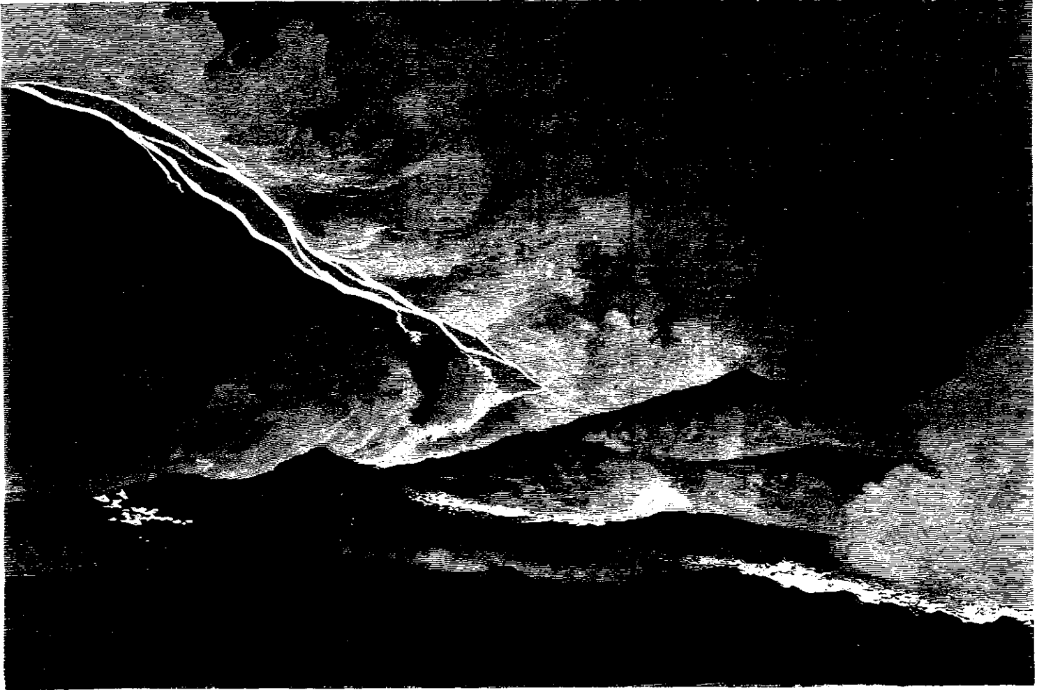
Vesuvus Udbrud. Lavastrømmens Gang, seet fra Resinasiden. Tegnet af D. L. O. V. G. e.

For at føre Logene op og ned ad de for sædvanlige Locomotiver ufremkommelige Stræker og om de skarpe Bøininger, har Driftstyreren Jell udtænkt et aldeles nyt System, som har vist sig fuldkomment hensigtsvarende. Han har nemlig midt paa Banen, imellem de to sædvanlige Skinner, paa fjorten Tommers Høide lagt en tredje, i hvilken fire under Locomotivet anbragte, vandrette Driohjul gribe fat og