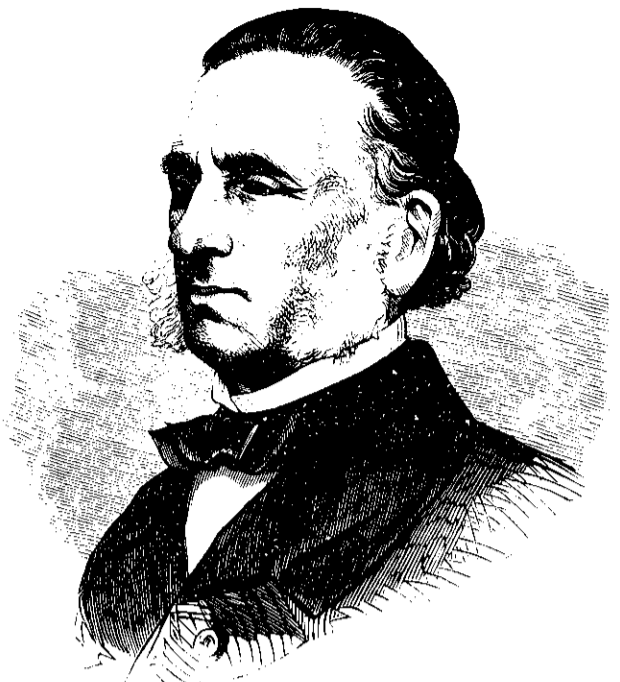
Armand Trousseau, fransk Læge.

Joseph, der er høj og rank, har fra Barndommen af vænnet sig til en stiv, militær Holdning, som han aldrig kan aflægge, og han befinder sig bedst i Uniformen, som han da ogsaa har ved denne Leilighed. Keiser Napoleon, der er lille af Væxt og lidt corpulent, havde under Reisen indrettet sig efter sin Befømmelighed, og han traadte frem uden al Pomp, iført en simpel Civillædning, idet han med en vis Nonchalance stred igennem den ærbødige Mængde. Keiserinden af Østerrig er en høj, majestætisk Stikkelse med blege Træk — en Følge af hendes Brystsvaghed — og hun glemmer aldrig sin Værdighed. Hun var ved denne Leilighed klædt i Gala, hendes Kjole var overordentlig lang, og et omsfangrigt Slæb feiede Gulvet, da hun med asmaatte Stridt gik sine Gæster imøde. Keiserinde Eugenie er lille af Væxt, fylbig uden Overdrivelse, med et Ansigt, der straalte af Sundhed og Lykke, og hun bevæger sig uden den ceremonielle Holdning, som hos saa Mange er uadskillelig fra Tanken om en fyrstelig Dame. Hendes Paaklædning svarede hertil: en kort Kjole, der standsede lidt ovenfor Halsbåndene, en let Reisehat og en Mantille om Skuldrene; Alt var af den yderste Elegance,