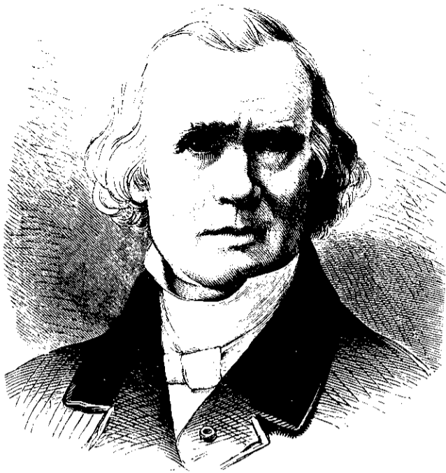
Alfred Velpeau, fransk Chirurg.