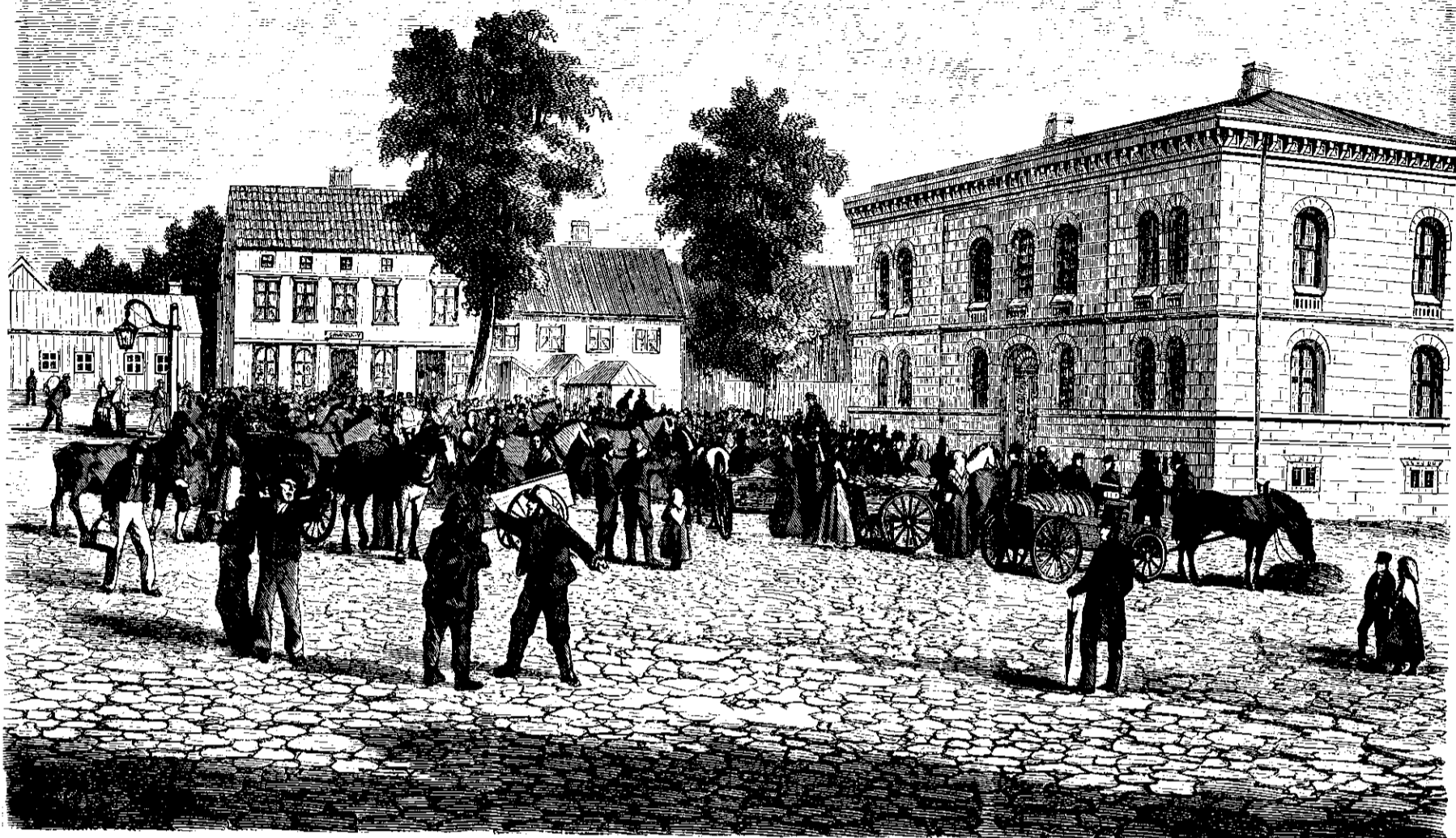
Parti af Torvet i Trondheim med det nye Raadhuus. Tegnet af Carl Laegre.

Veien var baade længere og steilere end han nogenstinde havde tænkt sig eller drømt om.