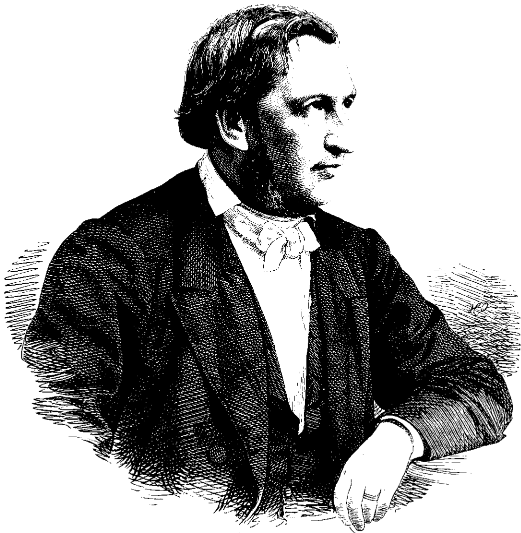
André Oscar Wallenberg, Directeur for Stockholms Privatbank.