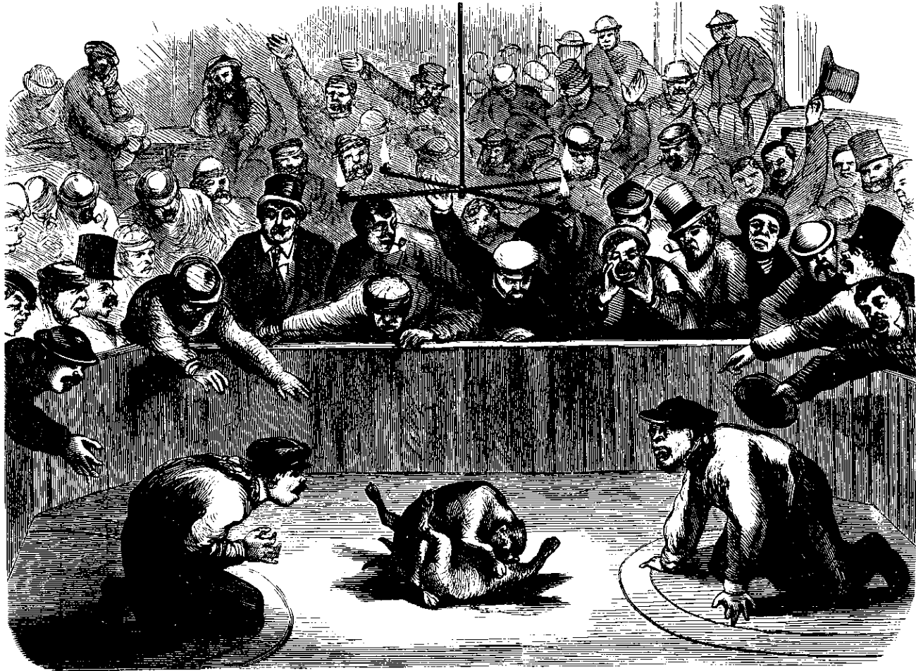
Forestilling i »Kit Burns' Sportsmens Hall« i New York.