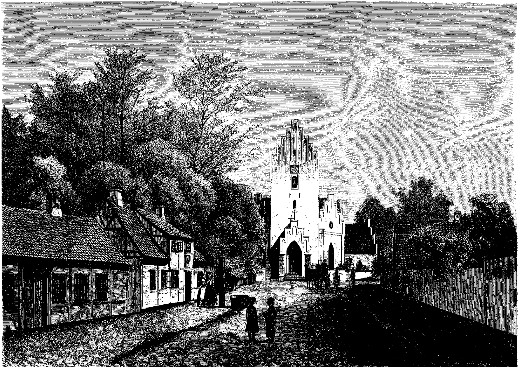
Storchedinge Kirke. Tegnet af G. Emil Libert.