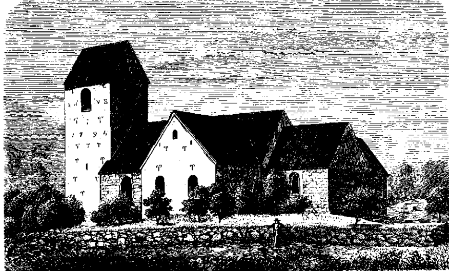
Gunderup Kirke i Aalborg Amt.